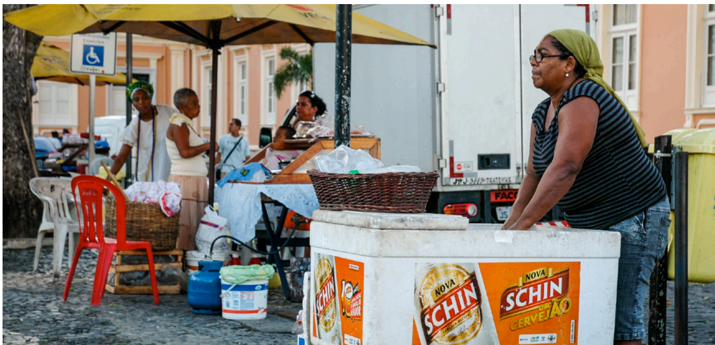
Una vendedora ambulante en Brasil.