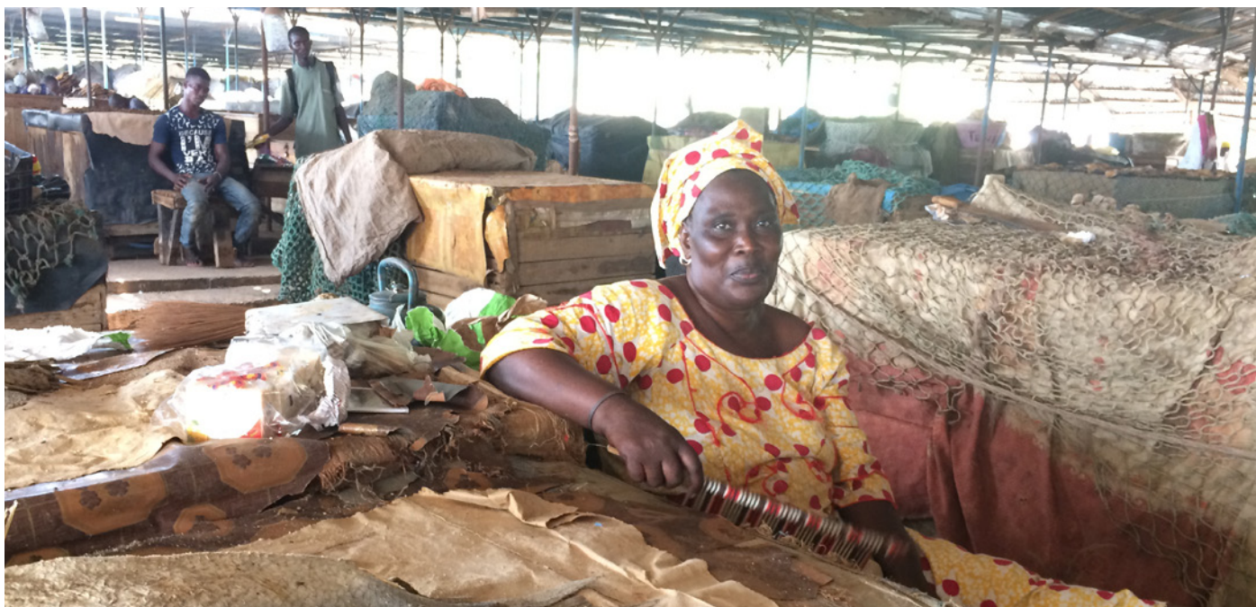
Una comerciante de mercado en Dakar, Senegal.