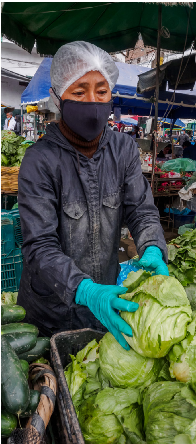
Una vendedora ambulante durante la pandemia de la COVID-19 en Lima, Perú.