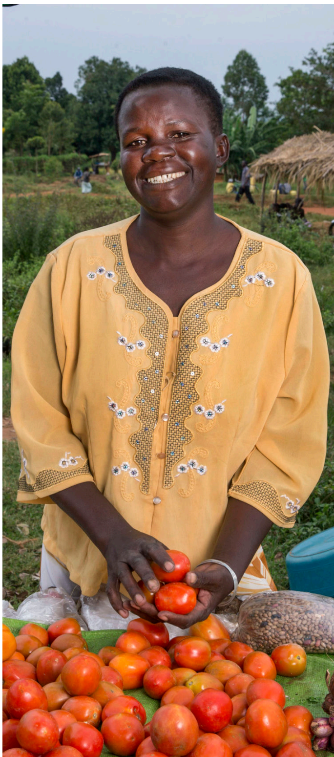
Una comerciante de mercado en Uganda.