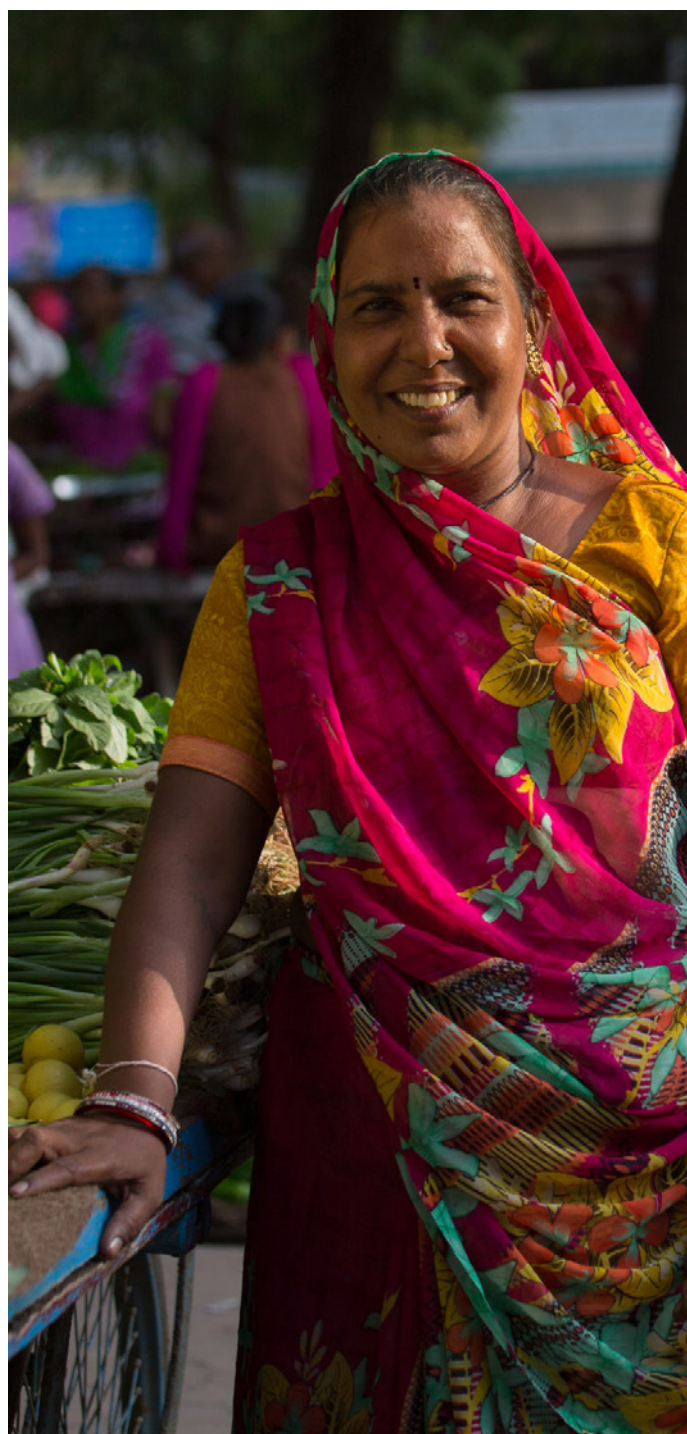
Una comerciante de mercado miembro de la Asociación de Mujeres Autoempleadas (SEWA) en India.

En 9 países predominan las mujeres entre las personas vendedoras ambulantes: Ghana, donde representan el 83 % de este grupo de personas trabajadoras, Perú (68 %), El Salvador (67 %), Sudáfrica (62 %), Senegal (57 %), México (56 %), Uganda (54 %) y Brasil y Tailandia (ambos con el 53 %). Los países con