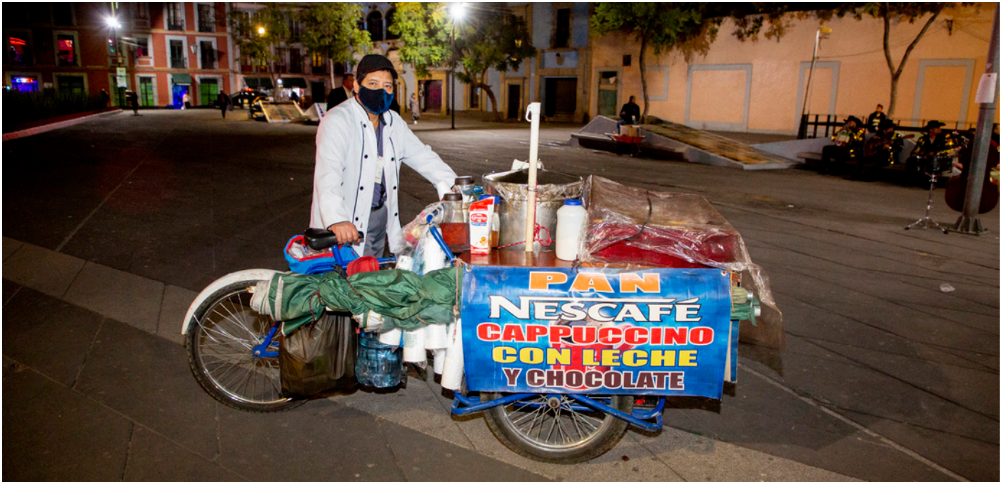
Un vendedor ambulante durante la pandemia de la COVID-19 en la Ciudad de México, México.