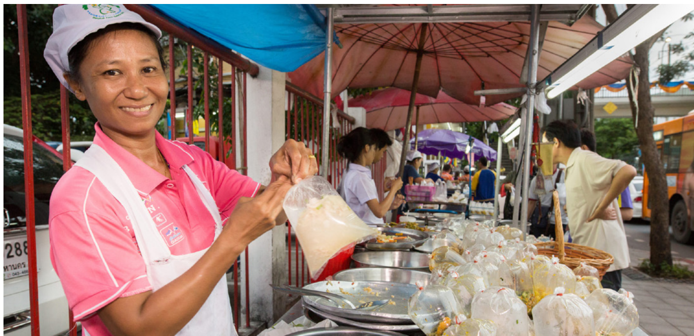
Una vendedora ambulante en Bangkok, Tailandia.

nacional. Las diferencias entre el promedio nacional y el de la ciudad principal no son marcadas, excepto en Turquía, donde el 62 % de las personas comerciantes de mercado a nivel nacional tienen empleo informal, en comparación con el 53 % en Estambul, así como el 79 % de las personas vendedoras ambulantes a nivel nacional, frente al 72 % en Estambul.