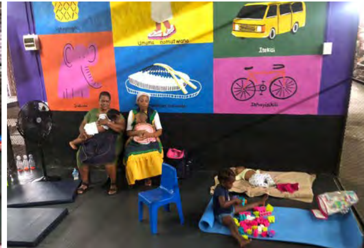
Los centros del mercado de Durban cuentan con material educativo.