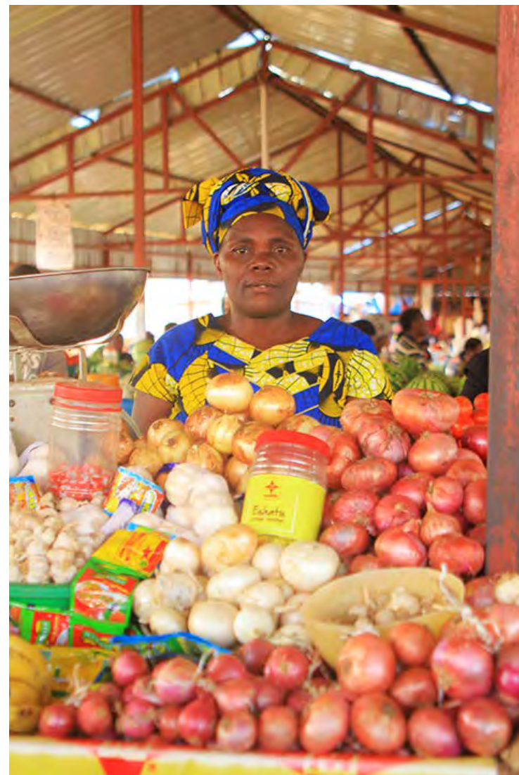
Comerciendo en un mercado de Kigali.

En Ruanda , se están construyendo centros informales de cuidado infantil con las familias al timón, apoyadas por las capacitaciones del Gobierno y de WIEGO. Mediante campañas de concientización en los medios, las personas comerciantes están viendo los beneficios de los centros de desarrollo de la primera infancia que, por un lado, garantizan que las infancias estén seguras y estimuladas, y, por otro lado, alivianan la carga que implica hacer malabares entre el cuidado infantil y alimentar una familia, que recae sobre las mujeres.