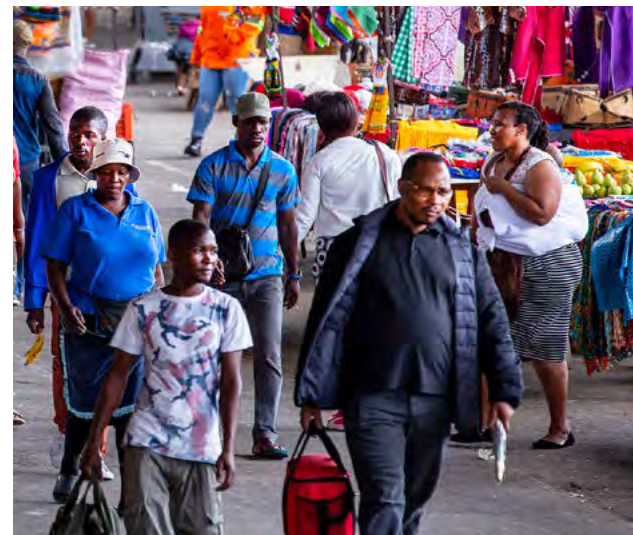
En Warwick Junction, Durban.