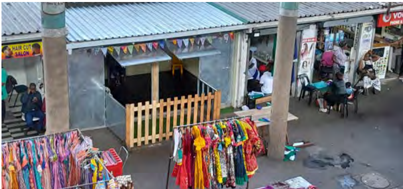
Los espacios menos utilizados entre los kioscos se convirtieron en servicios de cuidado infantil emergente en los mercados de Durban.

Si bien encontrar 18 m 2 para un centro de cuidado infantil puede ser un gran desafío en un contexto competitivo de mercado en el centro de la ciudad, AeT encontró espacios poco utilizados entre los kioscos del mercado de Brook Street (un mercado que vende delantales, sombreros, calzado y bolsos) y el mercado Early Morning (un mercado de verduras) que podrían ser centros emergentes de cuidado infantil, cerca de donde trabajan las madres 66 . Comenzaron a trabajar en un cajón de cuidados que evolucionó del concepto de cuna callejera. El cajón de cuidados ofrece las comodidades legales, como espacio para preparar comida, cambiar pañales o una enfermería.