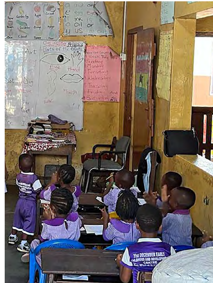
Aprendizaje temprano en la guardería de Makola Market, en Accra.