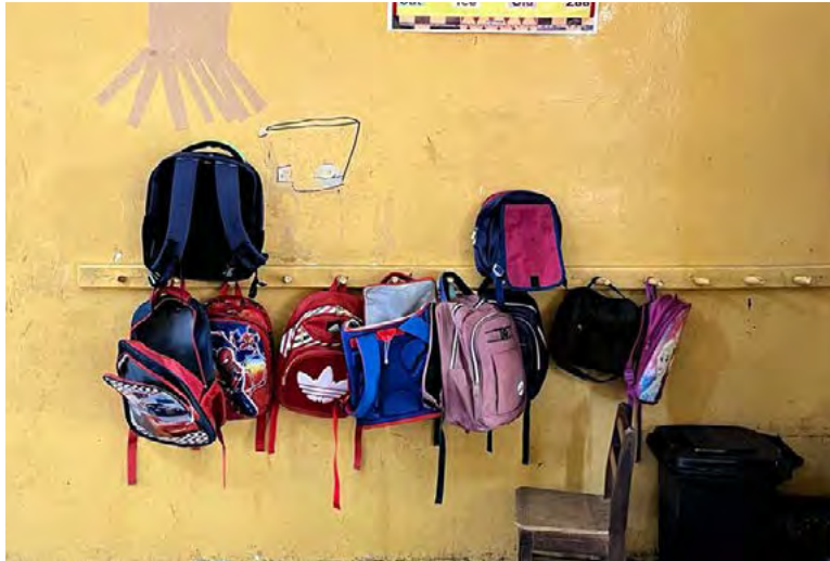
Al frente de la guardería del mercado de Makola, en Accra.