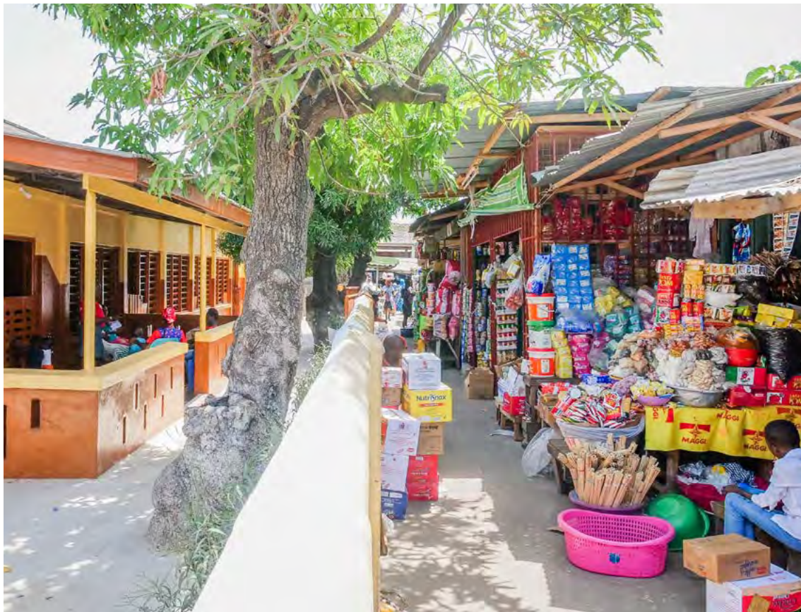
El centro de cuidado infantil del mercado Makola se encuentra al lado del mercado.