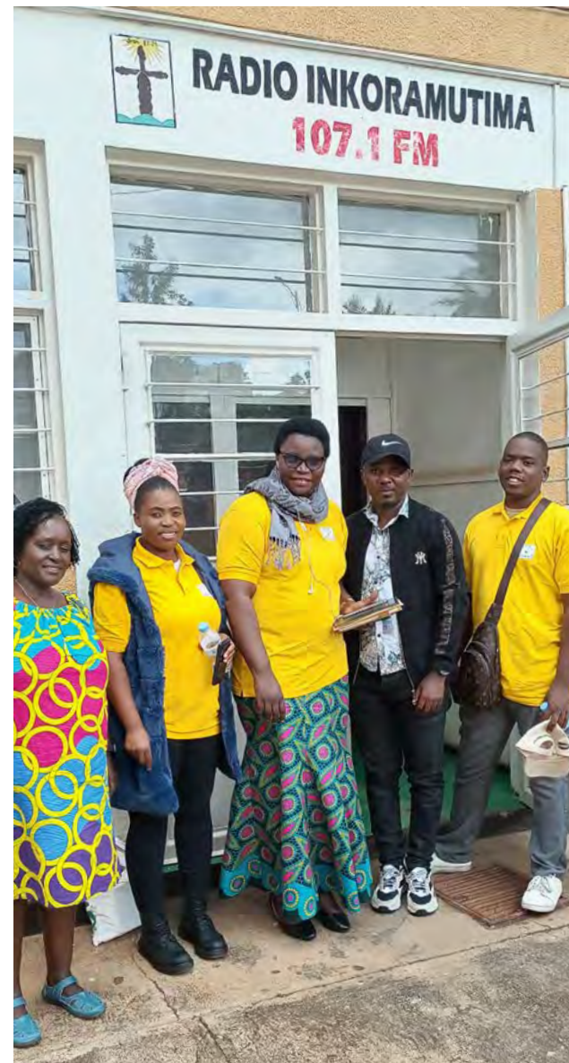
Se está utilizando la radio para difundir información sobre el proyecto de cuidado infantil en los mercados.

El Gobierno provee leche a estos centros informales y les ofrece capacitaciones sobre cuidado infantil para algunos grupos.