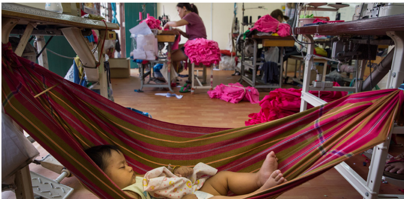
Un bebé de 6 meses de edad duerme la siesta mientras su mamá trabaja en una fábrica de prendas de vestir en Bangkok, Tailandia.

“ Antes de tener hijos, solía trabajar hasta tarde, hasta las 4 o las 5 de la tarde. Los camiones traen buenos productos al final del día y siento que me estoy perdiendo todo eso. ”