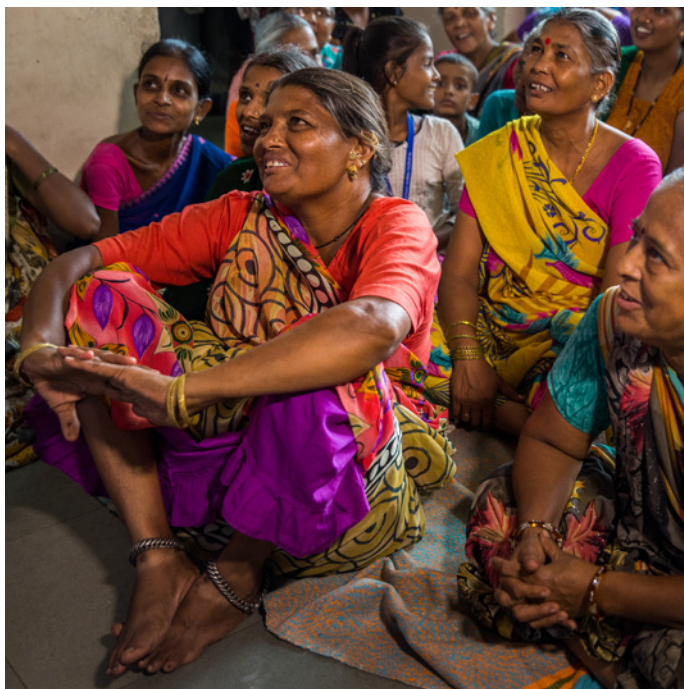
Un grupo de mujeres escuchando acerca de alimentos saludables durante una reunión nutricional en el centro BalSEWA en Ahmedabad, India.

los cuidados no remunerados implica que las mujeres no pueden ahorrar para su vejez. Si bien este es un problema que pueden experimentar todas las trabajadoras, aquellas en empleo informal en los países en vías de desarrollo son las que lo sufren con mayor intensidad al carecer de la protección social y laboral que disponen las trabajadoras en empleo formal para gestionar el cuidado de los niños y el trabajo remunerado. De esta manera, la responsabilidad sobre los cuidados no remunerados genera y refuerza la desigualdad social.