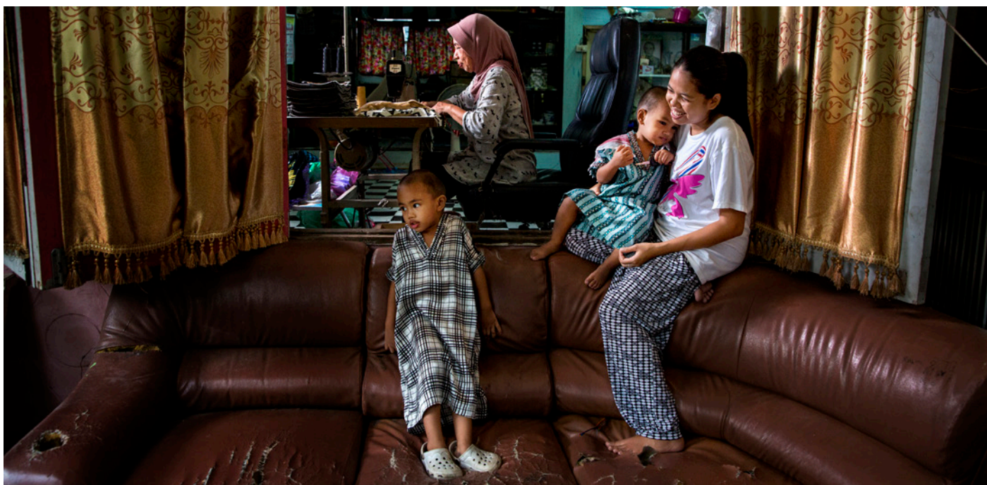
Una trabajadora a domicilio cose prendas de vestir mientras sus nietos juegan en su hogar en Bangkok, Tailandia.

al cuidado infantil organizado (ONU Mujeres 2015). En este estudio, muchas más mujeres tuvieron acceso a estos servicios. Esto es debido a la situación de los países donde el estudio se desarrolló, y a que las mujeres entrevistadas pertenecían a organizaciones que han estado formando a sus miembros sobre servicios de cuidado infantil, y en el caso de SEWA, proporcionando estos servicios. Aparte de las guarderías de SEWA, las mujeres en India también disponen de acceso a centros del Programa de Servicios Integrados para el Desarrollo del Niño (ICDS, por su sigla en inglés). En Brasil el estado ha puesto en marcha guarderías gratuitas desde la década de 1960 (Ogando y Brito 2016), y en Ghana las mujeres informaron que podían llevar a sus hijos a las guarderías a partir de 1 año de edad.