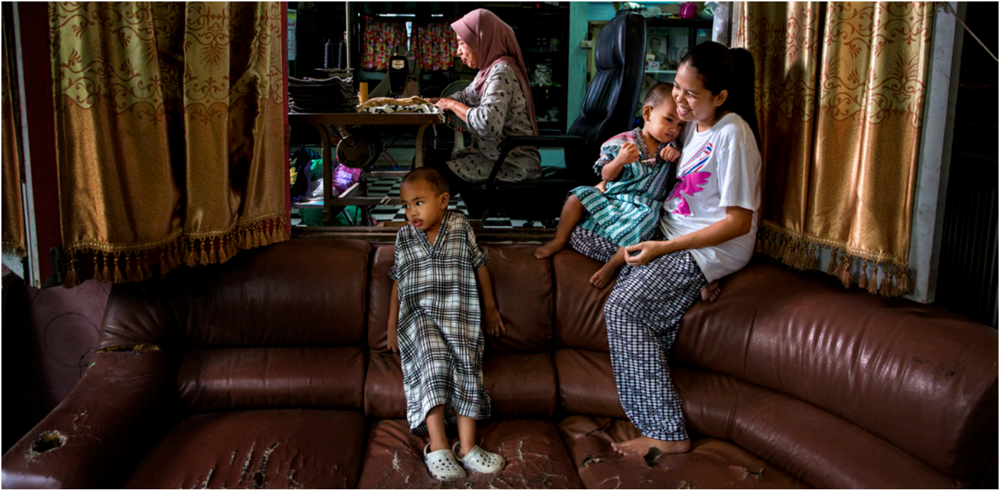
แรงงานที่รับงานไปทำที่บ้านกำลังเย็บผ้าในขณะที่หลานของเธอเล่นอยู่ในบ้านในกรุงเทพฯ ประเทศไทย

ยังสามารถเข้าถึงศูนย์แผนงานการพัฒนาเด็กแบบบูรณาการ (Integrated Child Development Scheme, ICDS) ซึ่งจัดให้โดยรัฐโดยไม่มีค่าใช้จ่าย ในประเทศบราซิล รัฐให้การดูแลเด็กโดยไม่มีค่าใช้จ่ายตั้งแต่ช่วงยุคปี 1960 (Ogando and Brito, 2016) และในประเทศกานา มีรายงานว่าผู้หญิงสามารถส่งบุตรหลานของตนเข้าสถานศึกษาก่อนวัยเรียนได้ตั้งแต่อายุเพียงหนึ่งปี