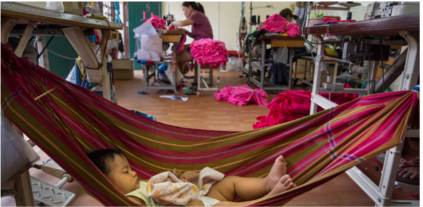
เด็กน้อยอายุ 6 เดือนซึ่งเป็นลูกของแรงงานตัดเย็บเสื้อผ้าอนหลักขณะที่ผู้เป็นแม่กำลังเย็บผ้าในโรงงานแห่งหนึ่งในกรุงเทพฯ ประเทศไทย

“ ก่อนหน้าที่ยังไม่มีลูกเล็ก ฉันเคยทำงานจนเย็นถึงประมาณ 16:00 น. หรือ 17:00 น. รถบรรทุกจะเอาวัตถุดิบดีๆ มาส่งในช่วงเย็น ฉันรู้สึกว่ามันดีของพวกนี้ทั้งหมด ” แม่ค้าในตลาดชาวแอฟริกาใต้