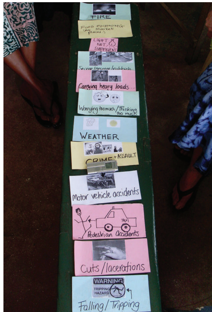
Tarjetas de peligro desarrolladas durante un ejercicio de grupo focal con vendedores ambulantes y de mercado en Acra, Ghana.

Dos técnicas claves que fueron utilizadas durante las discusiones de los grupos focales fueron “tarjetas de peligro” y la “lista de verificación de salud”. Las tarjetas de peligro son tarjetas ilustrativas con fotos y palabras pegadas describiendo peligros comunes de salud y seguridad en áreas de comercio. Estas tarjetas fueron desplegadas y se les preguntó a los participantes si habían algunas tarjetas ilustrativas que quisieran añadir a la colección. Una vez que se añadían tarjetas adicionales, se les