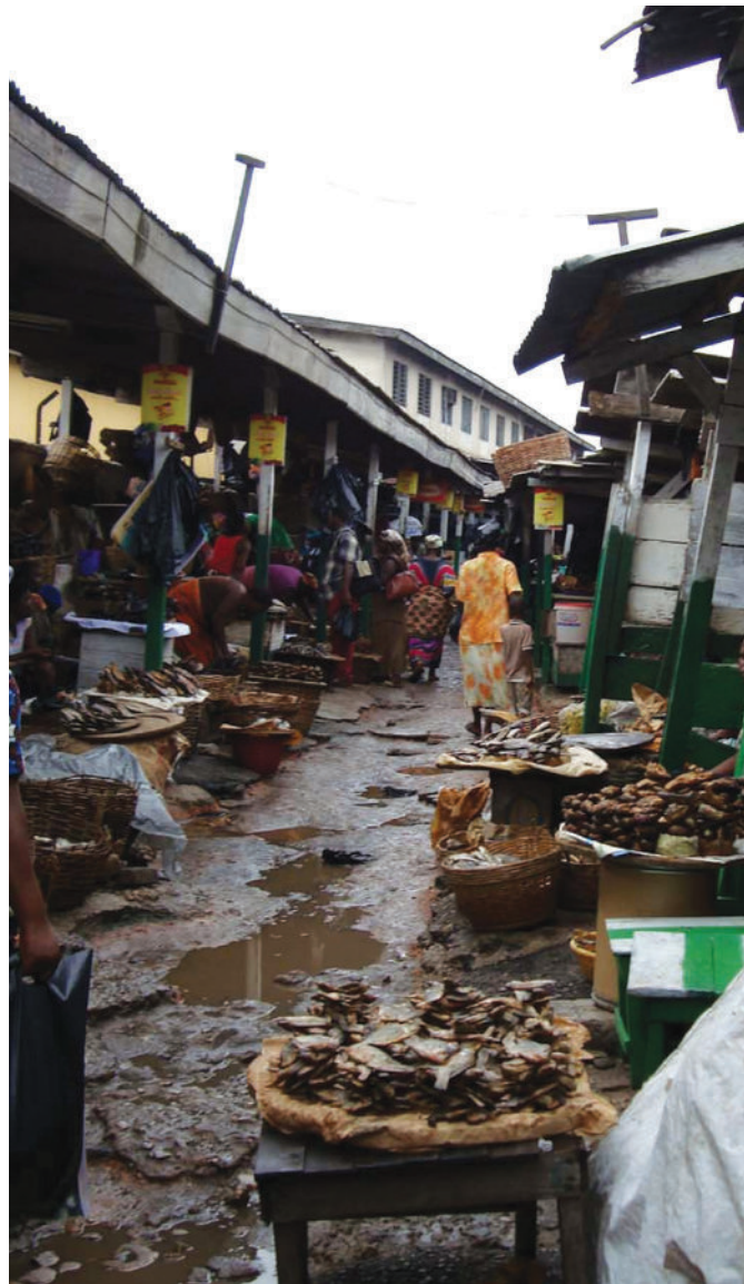
Photo : L. Alférs, risques pour la santé trouvés dans les marchés à Accra, au Ghana 2010.

Bon nombre d'emplois informels ne sont pas seulement « flexibles, précaires et peu sûrs », mais aussi dangereux et pratiqués dans des contextes qui sont tant