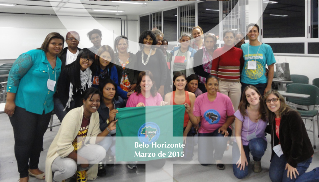
Belo Horizonte Marzo de 2015