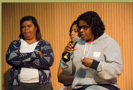
Encontro Geral com catadoras e catadores do Brasil e da América Latina para discutir o Projeto Gênero e Reciclagem, abril de 2015.