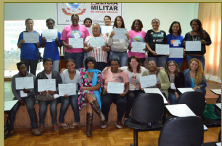
Fotos dos workshops em Conselheiro Lafaiete, agosto de 2013 e em Itaipua, outubro de 2013.