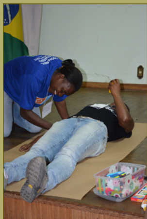
Fotos do workshop em Conselheiro Lafaiete, agosto de 2013 e em Itaúna, outubro de 2013.

Ao ter as mulheres focadas nos diversos atributos conflitantes relacionados aos papéis de gênero, as facilitadoras puderam incentivar uma reflexão mais crítica sobre como as mulheres têm superado diferentes obstáculos e estereótipos na sociedade contemporânea. Essa atividade revelou ainda que, embora as catadoras não demonstram ter problemas em