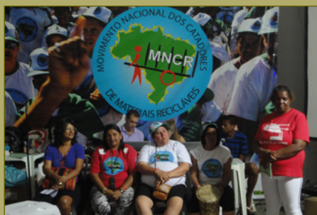
Rio+20, junho de 2012.