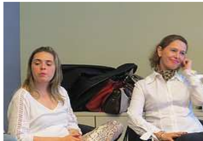
Equipe do ICF