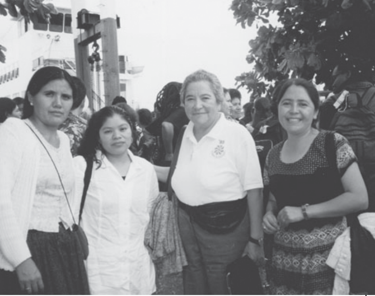
拉丁美洲 / 加納比：CONLACTRAHO在過去二十年來，致力聯結該地的各個家政工組織。