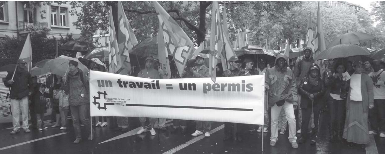
瑞士：在日內瓦，SIT工會一直爭取保衛外傭權益，這包括沒有正式證明文件、被稱為「非法」的外傭。為了強大他們爭取立法的游說力量，他們號召了工會朋友、左翼政黨、和家政工僱主組成僱主聯會。與此同時，另一瑞士工會UNIA正與政府，為從事在家工作的工人，謀求保障協議，包括最低工資和工時規定。