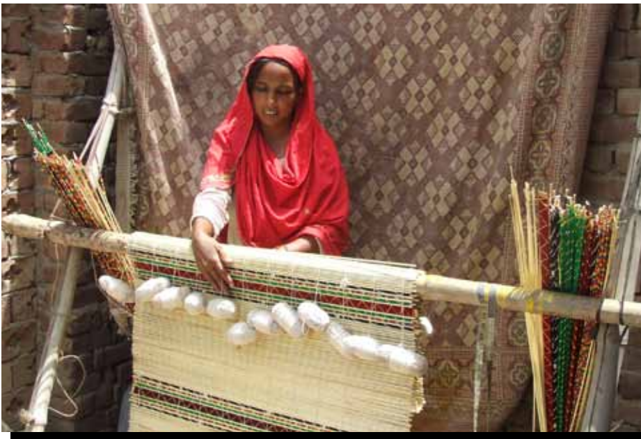
Una trabajadora a domicilio por cuenta propia en Kasur, Pakistán haciendo persianas tradicionales, o chiks.

despidos y medidas de austeridad en la economía formal persisten, empujando a más ingresantes al trabajo informal. En la Ronda 2, los recicladores reportaron un repunte de los precios que reciben por los productos reciclados, pero los precios, así como el volumen de residuos disponibles, continúan siendo inferiores a los niveles previos a la crisis. Los trabajadores a domicilio por cuenta propia informaron una disminución continua de la demanda. Los compradores locales continúan comprando menos – y compran con menos frecuencia – que lo que hacían antes de la crisis, y las ventas relacionadas con el turismo no se han recuperado. Mientras que los trabajado-