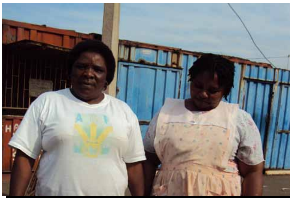
Vendedoras ambulantes en el sitio de venta Besters en Durban, Sudáfrica.

Transferencias monetarias – Los tres grupos priorizaron los programas de transferencia monetaria. Pero temían que la condicionalidad pudiera representar un serio desafío para los trabajadores informales. Los encuestados trabajan largos días bajo condiciones laborales inciertas y quieren evitar los costos de oportunidad asociados con períodos de tiempo fuera del trabajo para satisfacer determinadas condiciones. Sienten que las transferencias monetarias incondicionales podrían ayudarlos y a sus familias a cubrir mejor los costos de los servicios sociales básicos como transporte, materiales escolares y uniformes, medicamentos y tratamientos. Estos programas podrían facilitar a combatir futuros desajustes en el sistema económico, evidenciados por el aumento en escala de la Bolsa Familia 76 de Brasil durante la crisis.