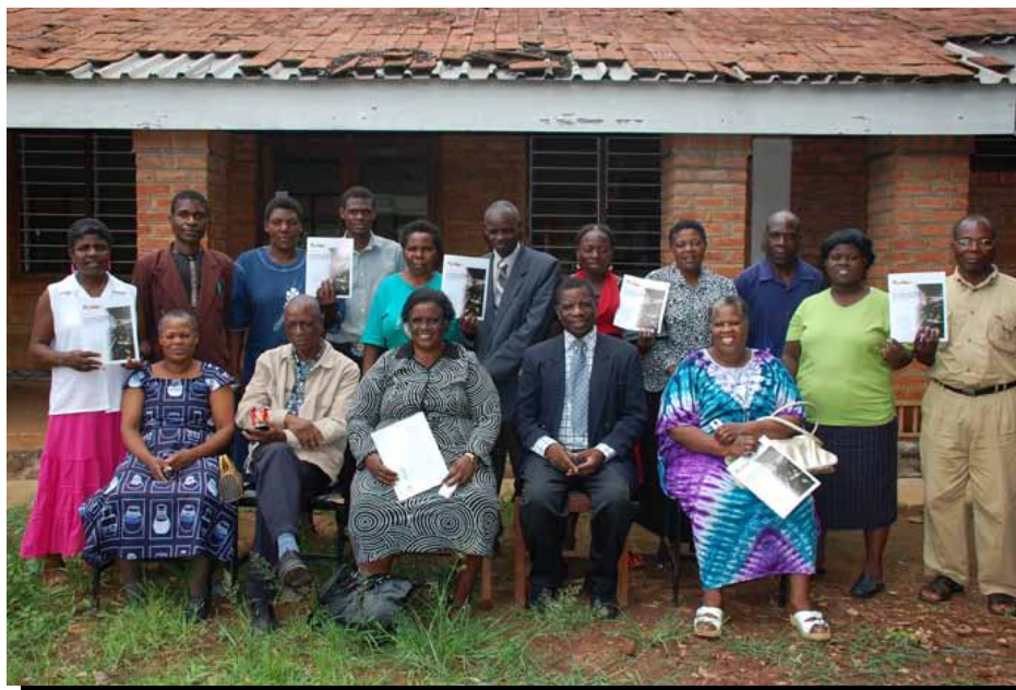
Participantes con el primer informe del estudio, “ Sin colchón que amortigüe la caída ” en Blantyre, Malawi.

por la crisis en muchas de las mismas maneras que las empresas y los trabajadores asalariados de la economía formal. Además de la disminución de la demanda, los participantes enfrentaron una mayor competencia por los nuevos ingresantes al empleo de la economía informal; los participantes también tenían poco acceso a protecciones sociales o económicas. La investigación adicional en Asia 3 reforzó la evidencia que, si bien la economía informal proporcionaba algunas oportunidades laborales para los trabajadores despedidos de la economía formal, las ganancias fueron limitadas y las condiciones laborales fueron difíciles. La economía informal no ofreció, como algunos habían expuesto, 4 un “colchón” para aquellos afectados por la crisis – ya fueran nuevos ingresantes o trabajadores de la economía informal tradicional. Además, los trabajadores de la economía