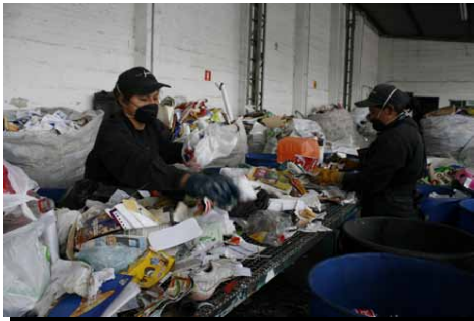
Recicladores informales clasificando residuos en un centro de reciclaje en Bogotá, Colombia.

A pesar de la reciente recuperación en el número y volumen de las órdenes de trabajo para los trabajadores a domicilio, el precio a destajo de los productores subcontratados en general se mantiene por debajo de los niveles previos a la crisis. En la Ronda 2, en comparación con la Ronda 1, a más de un tercio de productores subcontratados se les pagaba una tarifa a destajo inferior, casi la mitad no experimentó ningún cambio en la tarifa a destajo y sólo un sexto vio su tarifa mejorar.