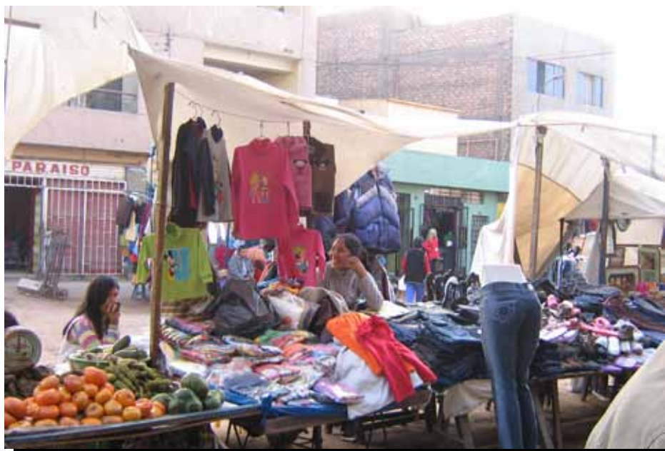
Vendedores ambulantes vendiendo sus productos en Lima, Perú.

ción de venta cerca del centro comercial, los vendedores sentían que su mejor opción era permanecer en el mercado de Besters. Como uno explicó, “Traté de comerciar en otra área, Veralum. La renta mensual era demasiado alta y no pude ganar suficiente dinero”. 50