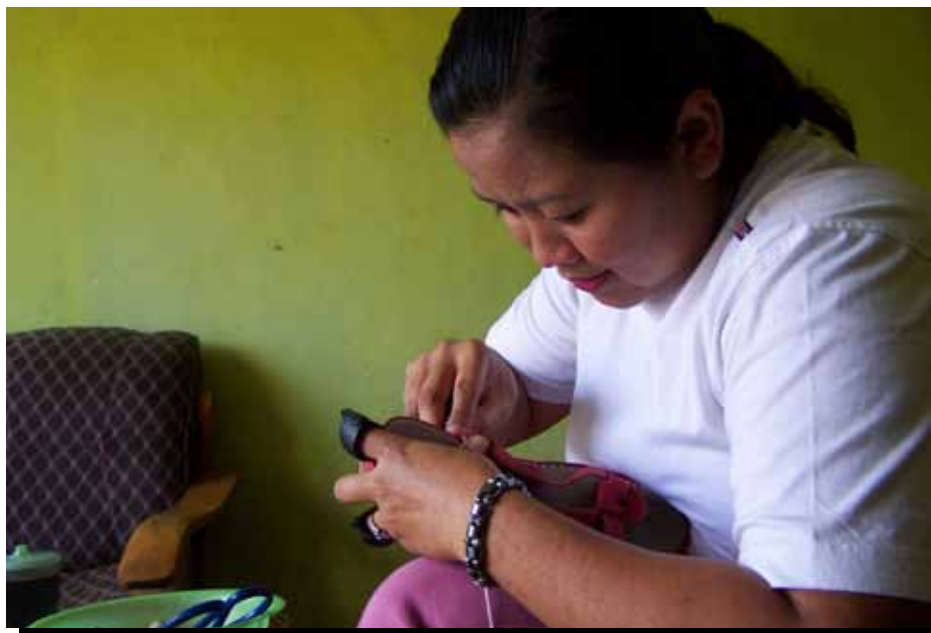
Una trabajadora a domicilio subcontratada en Malang, Indonesia haciendo calzado para la exportación.

empresas. 29 Entre todos los encuestados, el grupo con la proporción más baja que informó nuevos ingresantes fueron los trabajadores a domicilio por cuenta propia. De hecho, los productores de alimentos a domicilio en Hat Yai, Tailandia, informaron que algunos productores habían abandonado su trabajo debido a la disminución en el turismo – una tendencia que se ha exacerbado en gran medida por la agitación política continua, además de los gastos nacionales e internacionales restringidos en los días festivos. 30 31