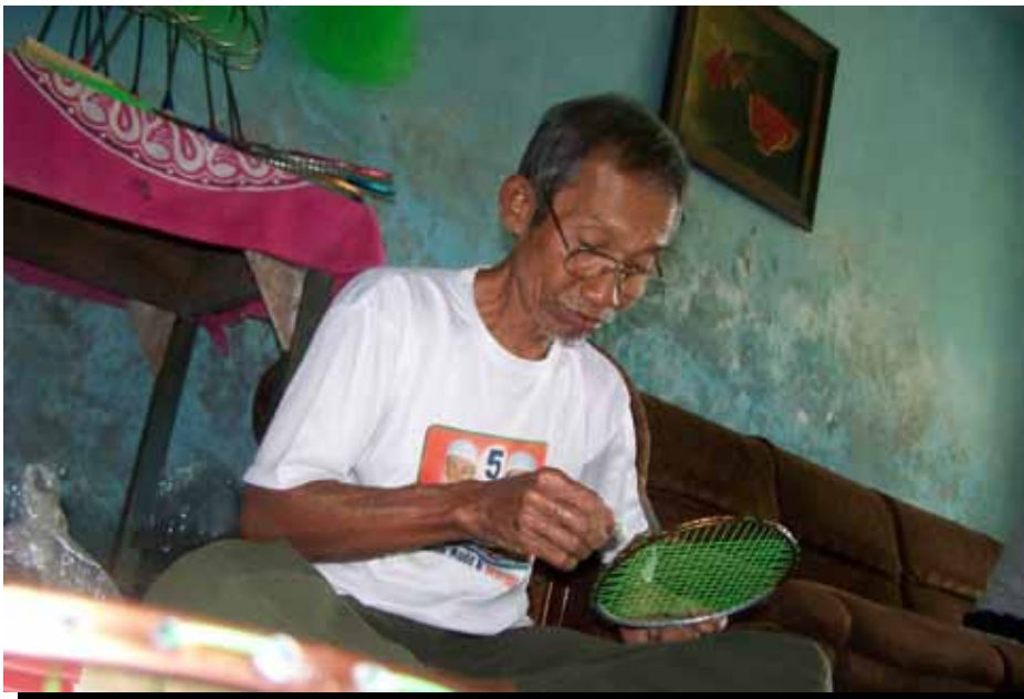
Un trabajador a domicilio subcontratado en Malang, Indonesia haciendo raquetas de bádminon.

A diferencia de los trabajadores subcontratados, los productores por cuenta propia a veces pueden ajustar sus precios para atraer compradores. Inicialmente, muy pocos productores por cuenta propia se atrevían a alienar a sus clientes mediante el aumento de precios. De hecho, durante el primer semestre de 2009, la mayoría redujo sus precios para poder competir en los concurridos mercados durante el apogeo de la crisis. En la Ronda 2, casi el 60 por ciento de los productores por cuenta