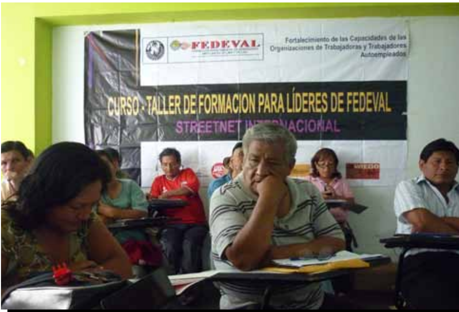
Vendedores ambulantes de FEDEVAL, socio del estudio, se reúnen en Lima, Perú.

Por otra parte, si bien la crisis económica global trajo nuevos desafíos a los participantes, también profundizó los problemas existentes. Muchos de los participantes ya vivían en un estado de “crisis”, luchando a diario para alimentar a sus familias. La globalización y la privatización han contribuido a erosionar las relaciones laborales. La inestabilidad política interna, los patrones climáticos extremos y los efectos persistentes de la crisis de alimentos y combustible han afectado a diferentes grupos de trabajadores en diferentes lugares, en diversos grados. Los encuestados a menudo eran incapaces de distinguir entre los impactos de estas fuerzas en sus vidas. También tuvieron dificultades para establecer las fechas para algunas de sus observaciones. En consecuencia, atribuir la relación de causalidad ha sido un reto.