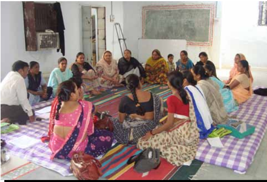
Participantes de SEWA, socio del estudio, participan en una discusión de grupo focal.

Los recicladores en Ahmadabad, India querían capacitación en técnicas de gestión de residuos y la certificación mediante tarjetas [o cédulas] de identidad para evitar el hostigamiento. En Pune, India, la condición de los recicladores ha mejorado después de que el sindicato local de recicladores, Kagad Katch Patra Kastakari Panchayat (KKPKP), brindó tarjetas de identidad y una capacitación bien diseñada para sus miembros.