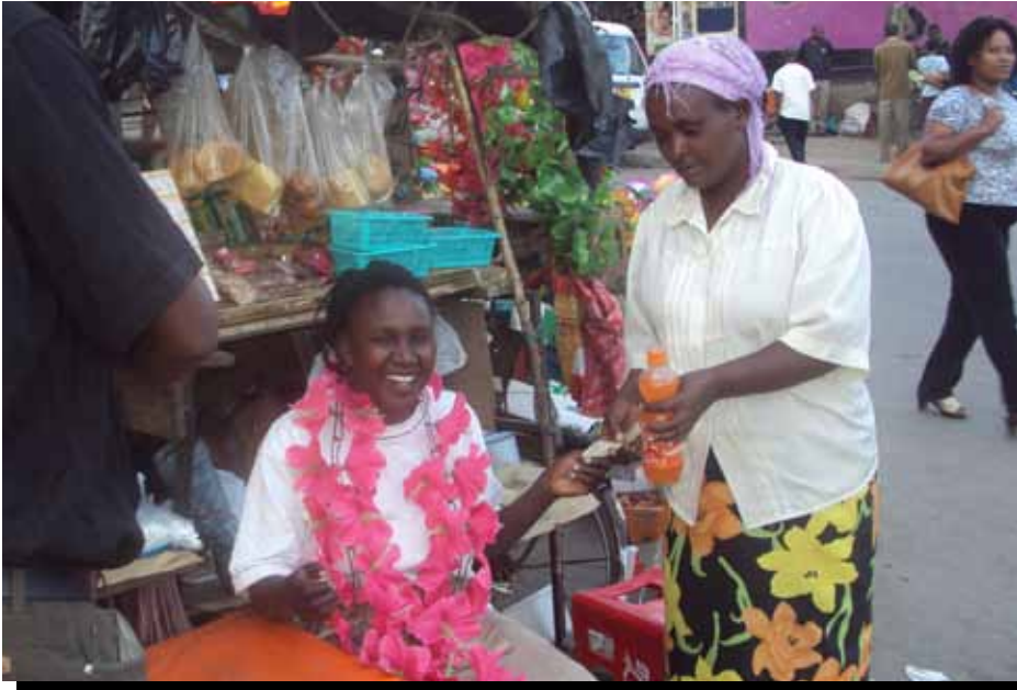
Vendedores ambulantes en el trabajo en Nakuru, Kenia.

la Ronda 1, los despidos de las empresas formales locales fueron identificados como el principal conductor de los nuevos ingresantes, 24 pero en la Ronda 2 una mayor proporción de participantes también señaló el aumento del costo de vida como impulsor de los nuevos ingresantes. Tanto en África como Asia, algunos de los encuestados identificaron a los recién graduados, incluyendo a sus propios hijos, entre los nuevos ingresantes.