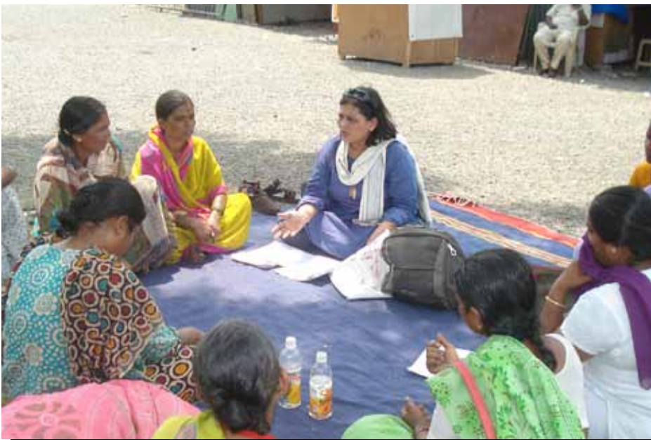
Recicladores informales de KKPKA, socio del estudio, participan en un grupo focal en Pune, India.

Los reclamos también están limitados por la dificultad de atribuir la causalidad durante el período de crisis. La crisis económica global trajo nuevos desafíos a los participantes, pero también agravó