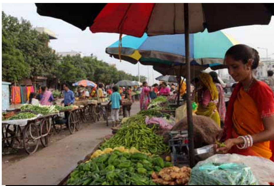
Vendedores ambulantes vendiendo verduras en Ahmedabad, India.

La crisis económica global ha traído nuevos desafíos para los participantes, y también ha exacerbado las tendencias y eventos económicos existentes. Las Rondas 1 y 2 de este estudio han monitoreado los impactos de estas tendencias económicas globales a través del período de la crisis. A pesar de los signos de modesta recuperación en algunos segmentos, los hallazgos de la Ronda 2 indican que hay un retraso en la recuperación de la economía informal. Las pruebas sugieren que el desempleo en los sectores formales sigue conduciendo a una mayor competencia dentro de la economía informal. Mientras que para algunos los ingresos han aumentado modestamente, no han aumentado a los niveles anteriores de la crisis y no han seguido el ritmo con la inflación. Las familias continúan restringiendo sus dietas, al mismo tiempo que parece incrementarse el retiro escolar de los niños.