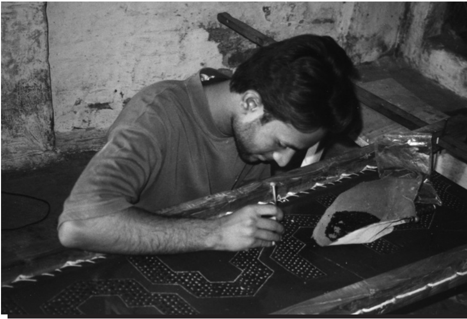
Trabajador a domicilio por cuenta propia bordando en Ahmedabad, India.

Muchos trabajadores de la economía informal viven en asentamientos informales. Los encuestados identificaron la necesidad crítica de mejorar los servicios básicos –vivienda, higiene, agua y electricidad. El no tener servicios básicos intensifica la carga laboral de las mujeres en particular, las trabajadoras informales. Tener servicios básicos deficientes implica que los trabajadores informales y sus familias sean vulnerables a enfermedades. Los ya magros ingresos disminuyen aún más