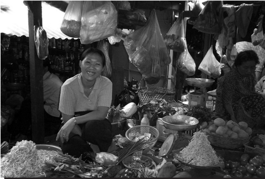
Vendedora ambulante de comida en Tailandia.