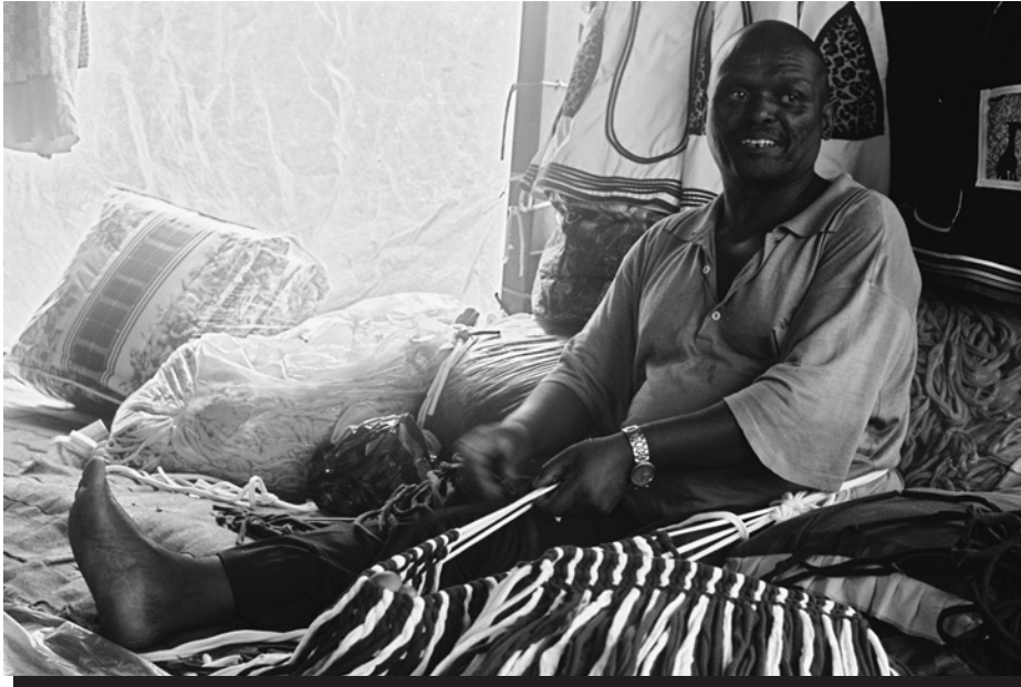
Vendedores ambulantes preparando sus productos en Durban, Sudáfrica.