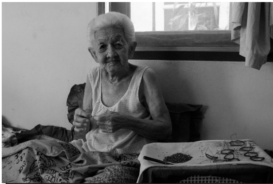
Trabajadora sub-contratada a domicilio bordando con pedrería en Bangkok, Tailandia.

Los trabajadores industriales sub-contratados a domicilio que producen para los mercados de exportación fueron los más susceptibles a los cambios en la demanda global. Los empleadores y contratistas en los sectores más afectados que dependen de la exportación tienen varios márgenes con los que se pueden ajustar en respuesta a la recesión: pueden reducir el número de trabajadores, el volumen de los pedidos y/o los salarios, dependiendo de su acuerdo laboral con sus trabajadores. En el Cuadro 3, más de la mitad (55%) de los trabajadores industriales – trabajadores a domicilio sub-contratados – reportaron que sus órdenes de trabajo se habían reducido y que el volumen de su producción había bajado significativamente en los últimos seis