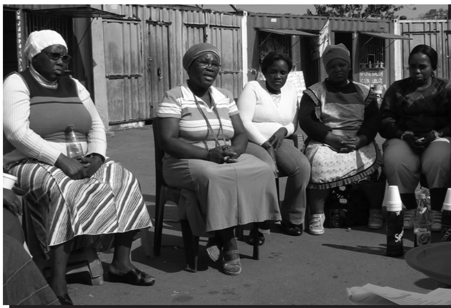
Los vendedores ambulantes expresan sus demandas en Durban, Sudáfrica.

Otros trabajadores perciben al gobierno desconectado de sus vidas cotidianas. No sólo los trabajadores no reciben protección social o económica de sus gobiernos, muchos trabajadores ni siquiera tienen acceso a las disposiciones básicas como escuelas públicas, centros de salud o incluso agua potable. Dos recicladores entrevistados en Colombia provenían de un barrio marginal o campamento , 67 y el grupo de trabajadores a domicilio en Pakistán vive en un pueblo sin hospital o escuela. Estos trabajadores tienen poca noción de la función positiva del gobierno u otras