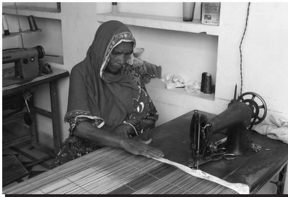
Trabajador a domicilio haciendo tapetes de carrizo en Kasur, Pakistán.