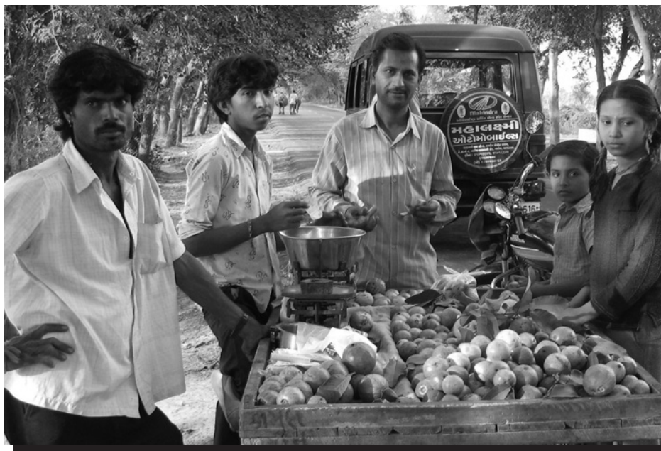
Vendedores ambulantes vendiendo sus productos en Ahmedabad, India.

Para los vendedores ambulantes, esta no fue una estrategia popular: como un vendedor en Malawi señaló: “Cuando cambias lugares, pierdes clientes.” 44 Sólo el 13 por ciento de los vendedores ambulantes informó que la competencia o la imposibilidad de pagar las cuotas municipales en zonas designadas comerciales, los han forzado a cambiar de lugar para comerciar. Varios trabajadores a domicilio, que venden sus mercancías en los puestos de mercado, reportaron que las tarifas del mercado los han sacado de sus locales de venta. En Tailandia, en el conocido Mercado Dominical – el Centro Comercial JJ – la tarifa ha aumentado de 200 baht/día (alrededor de USD 6) a 500 baht/día (alrededor de USD 15). Además, la creciente competencia en los mercados ha restringido el espacio, obligando a algunos trabajadores a empezar a vender sus productos en la calle.