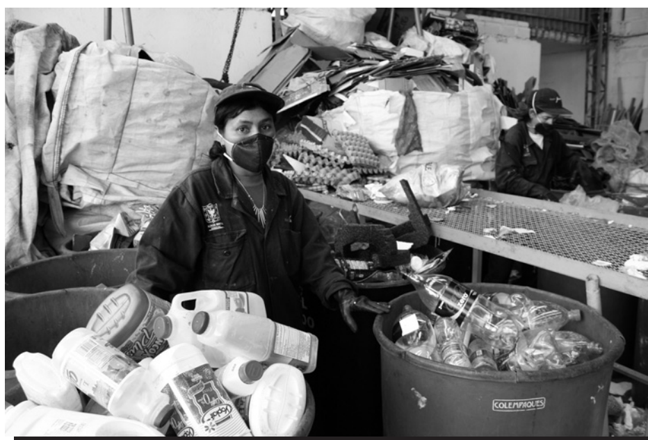
Reciclador clasificando material en el Centro de Reciclaje de Alquería en Bogotá, Colombia.

Un aumento de trabajadores informales durante las recesiones no es inesperado, y el empleo informal – como porcentaje del empleo total – también aumentó tras la crisis económica en América Latina durante el decenio de 1980 30 y en Asia a finales de los 1990. 31 Las presiones económicas asociadas con la recesión erosionan las relaciones laborales formales, y alientan a las