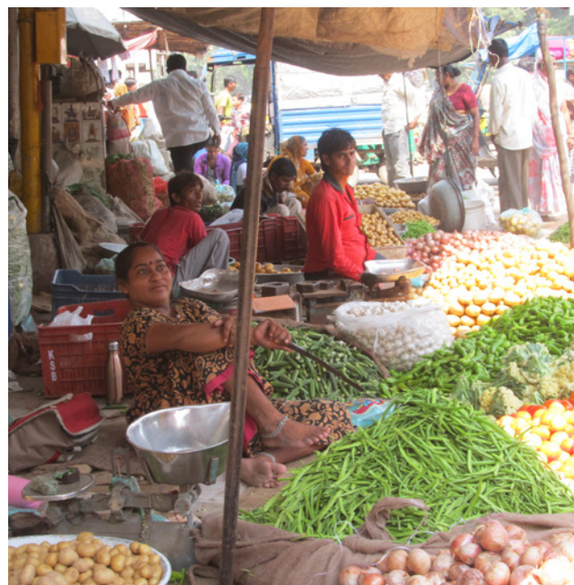
foto de Ahmedabad

Las regulaciones no deberían conferir poderes discrecionales a los oficiales de policía para establecer tarifas y multas. Se debería ofrecer capacitación a los oficiales de policía y a los vendedo-