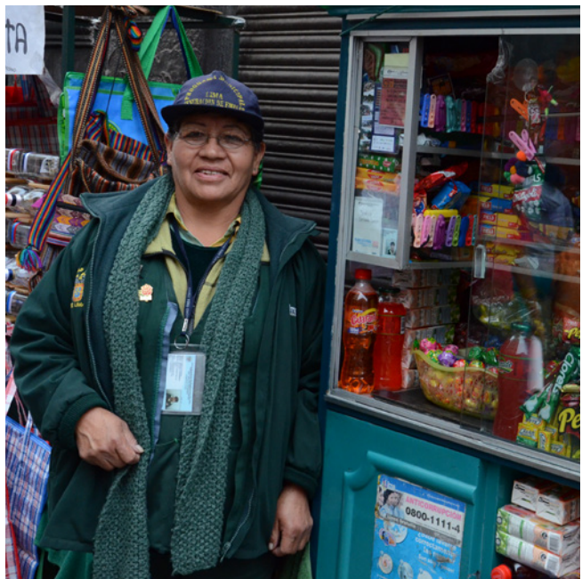
foto de Lima