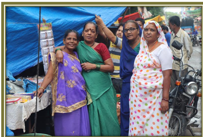
Mujeres líderes de la Asociación de Mujeres Auto-empleadas Madya Pradesh (SEWA MP). Leer más: streetnet.org.za/impact

Los mecanismos de compensación y control son importantes para abordar los problemas de violencia en el lugar de trabajo. Las autoridades respectivas tienen que desarrollar sistemas especialmente para la economía informal y también para los trabajadores en los lugares públicos. El papel del Estado es importante. El enfoque debe estar basado en los derechos y no solo desde el ángulo de la víctima.