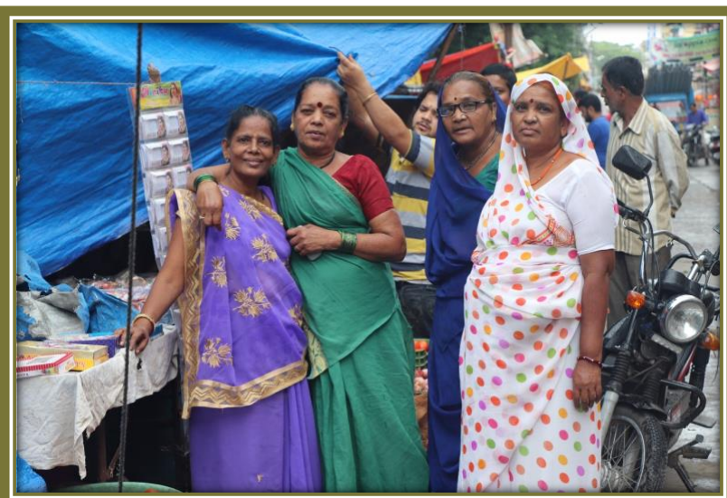
Femmes-leaders de l'Association des travailleuses indépendantes Madya Pradesh (SEWA MP). En savoir plus: streetnet.org.za/impact

Ici, le rôle de l'Etat, à nouveau, est important. L'approche devrait se faire par une perspective des droits et non pas sous un angle de victime.