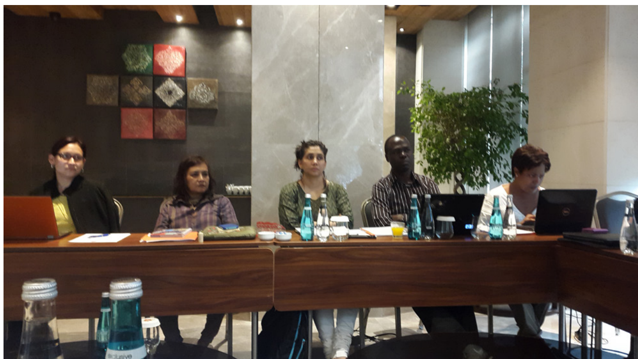
Coordinadores de diferentes regiones planifican para el futuro, Estambul, 2015.

En septiembre de 2015 WIEGO convocó una reunión de estrategia en Estambul. Este fue el escenario para que WIEGO y sus organizaciones socias se encontraran, para destacar los éxitos y desafíos que afrontan los trabajadores a domicilio, y para el desarrollo de planes de trabajo en conjunto tanto en el ámbito global como en cada una de las regiones –África, América Latina, el Sur y el Sudeste de Asia, y Europa del Este–. Los participantes se comprometieron a seguir construyendo el movimiento de trabajadores a domicilio, a pesar de los limitados recursos.