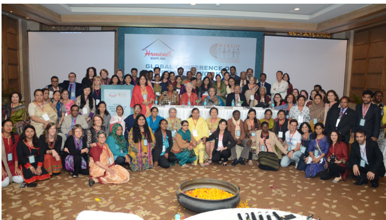
Participantes en la Conferencia Mundial sobre trabajadores a domicilio, 2015.

Más de cien representantes de trabajadores a domicilio y simpatizantes, de 24 países participaron en una Conferencia Mundial histórica sobre los trabajadores a domicilio, organizada por HomeNet del Sur de Asia (HNSA) y WIEGO en Nueva Delhi, India, en febrero de 2015. El encuentro concluyó con la elaboración de la Declaración de Delhi, primera declaración mundial para trabajadores a domicilio y en un Plan de Acción global para los siguientes cinco años.