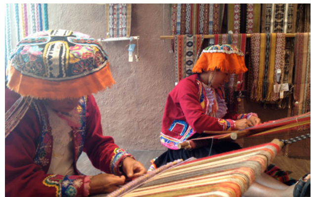
Trabajadoras a domicilio en Perú.

que estas regulaciones existen, Argentina continúa siendo el único país latinoamericano que ha ratificado el Convenio 177 de la OIT. Aunque Perú y Uruguay han incorporado aspectos del C177 a su actual legislación.