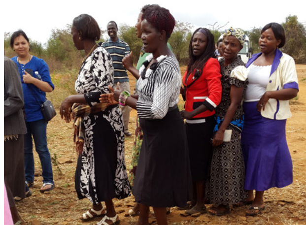
Visita al Grupo de mujeres de Malembwa en Kenia, 2014.

Durante el taller regional en Nairobi (2014) la South African Self-Employed Women's Association (SASEWA, Asociación Sudafricana de Mujeres Autoempleadas) fue identificada como organización de referencia en Sudáfrica para dirigir el proceso organizativo y de creación de redes entre los trabajadores a domicilio. WIEGO facilitó una serie de talleres de fomento de capacidades para las líderes y los miembros existentes o recién reclutados de SASEWA.