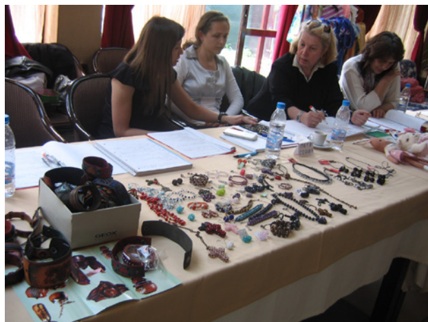
Taller de innovación en Sofía, Bulgaria.

En 2015, WIEGO y HNEE organizaron conjuntamente un taller de formación en Sofía, Bulgaria. Se centró en la planificación estratégica para la organización y la innovación de productos y mercados en las redes nacionales de Albania, Bulgaria, Georgia y Kirguistán. Al final del taller de cinco días, se intentó que los miembros hubieran adquirido una mayor comprensión sobre las técnicas de venta y los mercados disponibles –de gran importancia para los trabajadores a domicilio por cuenta propia. Este taller resultó también fundamental para el desarrollo de un Plan Estratégico para el avance de la HNEE y constituyó una revelación para los participantes.