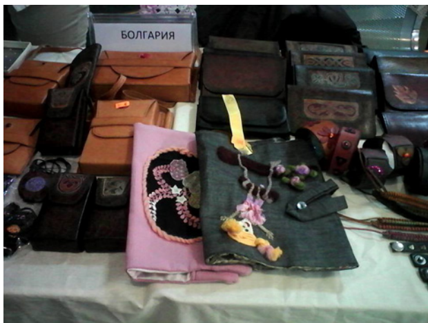
El Festival en Biskek, Kirguistán.

a los formuladores de políticas en Kirguistán las experiencias y buenas prácticas en Europa del Este en lo relativo a la organización, legislación y prácticas.