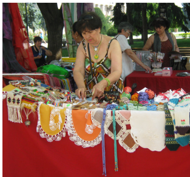
Segundo Festival Internacional de trabajadores a domicilio en Sofía, Bulgaria, en 2013.

Esta es la HomeNet más reciente. En una Conferencia Internacional en Sofía en marzo de 2012, se decidió crear una red de trabajadores a domicilio en los Balcanes a través de la firma de una Declaración Universal. Representantes de Bulgaria, Rumanía, Macedonia, Serbia, Albania,