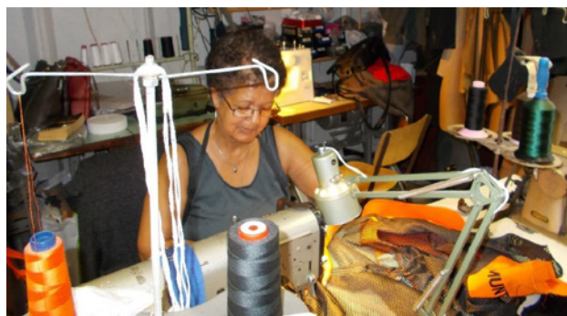
Costurera trabajando en un garaje, Athlone Ciudad del Cabo.

Cuando existen organizaciones de trabajadores a domicilio en Sudáfrica, tienden a ser frágiles. Los sindicatos no han tenido éxito en la organización de sus miembros anteriores y muchos de los grupos están apoyados por ONG. El tipo de apoyo ofrecido es diferente para los trabajadores artesanos y para los trabajadores de la industria de la confección. Para los primeros, el apoyo de ONG tiende a dirigirse a grupos sociales cuya formación puede no estar relacionada con motivos económicos, sino para conseguir acceso a los servicios de salud u