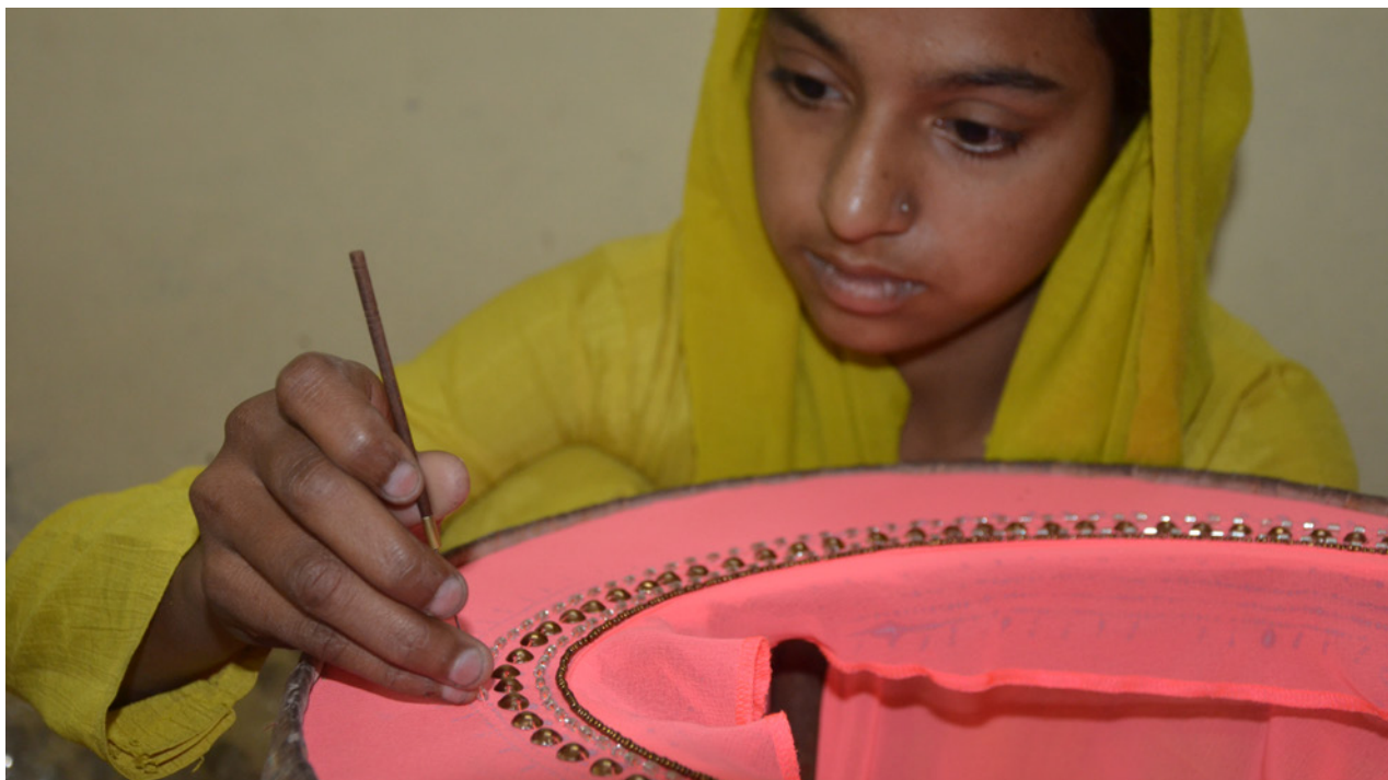
Una trabajadora a domicilio en India.