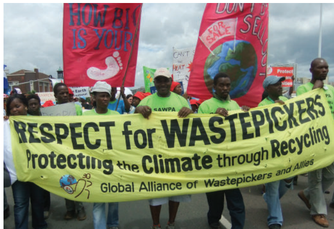
Recicladores se unen y se manifiestan en la COP17 en Durban.