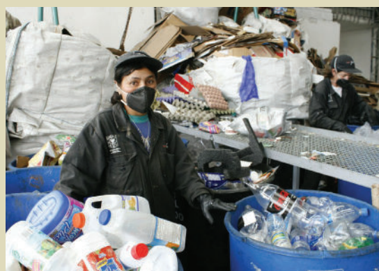
Centro de reciclaje Alquería, Bogotá.