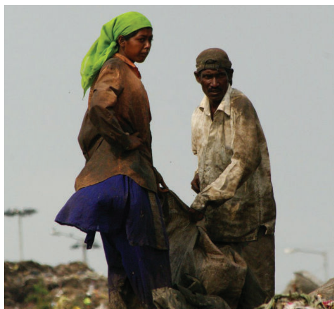
Vertedero Uruli en Pune.

El reciclaje es un oficio que ofrece un fácil acceso, flexibilidad de horarios y autonomía de los trabajadores. Si bien siguen siendo poblaciones vulnerables, los recicladores consiguen su trabajo y a menudo optan por trabajar en este sector, que puede ofrecer un mejor rendimiento en el trabajo que otras de sus opciones. La formalización y/o privatización no debe desplazar o excluir a los recicladores ya marginados, para quienes el sector del reciclaje informal les ha dado un espacio.