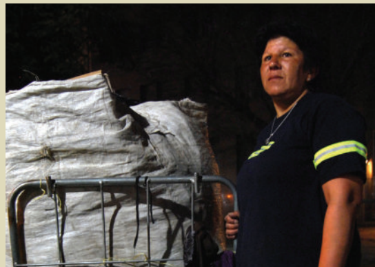
Cartoneando, Movimiento de Trabajadores Excluidos, Argentina.