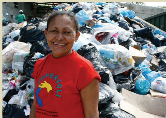
Une récupératrice à Coopersoli, Belo Horizonte.