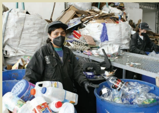
Centre de recyclage d'Alqueria, Bogota.