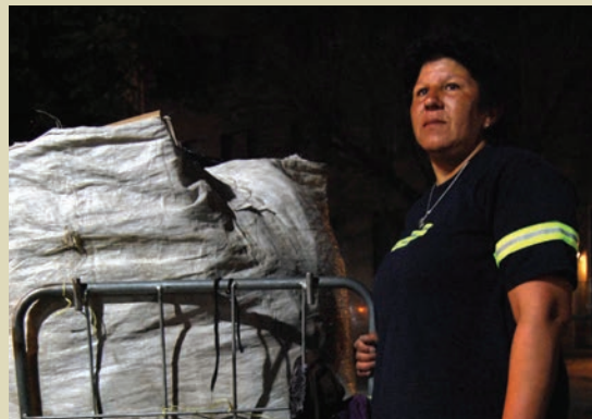
Cartoneando, Mouvement des travailleurs exclus, Argentine.