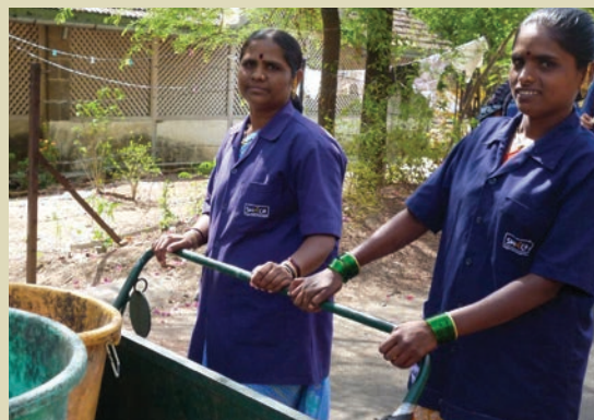
Une zone de collecte de SWaCH, Pune.