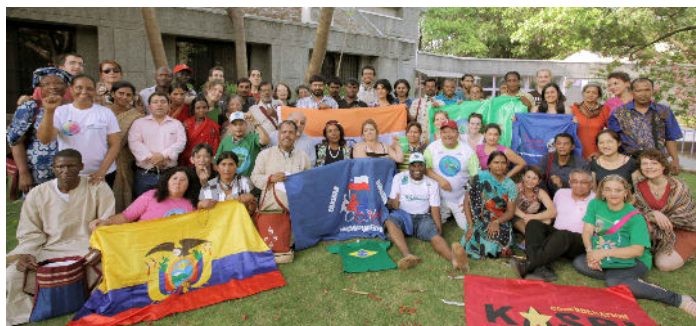
Foto de grupo en Pune 2012.

Al explorar las amenazas a sus medios de sustento, los recicladores encontraron mucho en común, y determinaron que las mayores amenazas en todos los continentes eran la privatización del acceso a los residuos (y el cambio de los sistemas de eliminación final de los residuos hacia la incineración y hacia los programas para convertir desechos en energía) y la corrupción gubernamental. También se identificaron como retos la necesidad de depender de intermediarios en lugar de vender