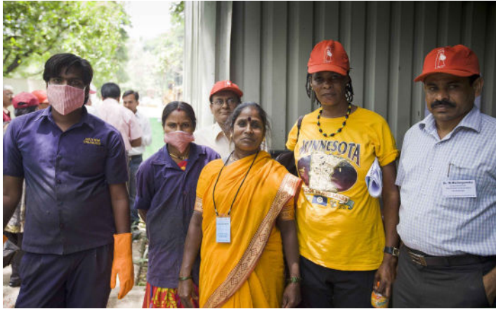
Visita de campo a la cooperativa SWaCH

A fin de sentar la base para las discusiones sobre la integración de los recicladores en los sistemas municipales, los participantes del taller fueron llevados a un recorrido guiado por el sistema integrado y descentralizado de gestión de residuos sólidos en uno de los distritos de la municipalidad de Pune. Los participantes vieron cómo trabajaban los recicladores informales que están organizados a través del sindicato de recicladores KKP KP. Mediante un contrato entre la Corporación Municipal de Pune y la cooperativa SWaCH, afiliada al KKP KP, los trabajadores son contratados para la recolección puerta a puerta, la separación, la eliminación de los desechos y el compostaje. El recorrido incluía la visita a dos sitios de compostaje donde residuos húmedos se convierten en un fertilizante natural valioso que se usa en los jardines y lechos de flores en el campus de una universidad y, con diferentes métodos, en las premisas de un centro de investigación. También se visitaron los locales en donde se separan los residuos, la tienda de chatarra del sindicato y una instalación de biogás. El proceso fue narrado por los guías, y los participantes fueron invitados a hacer preguntas a los trabajadores para asegurar que se pudiera aprender de la experiencia al máximo.