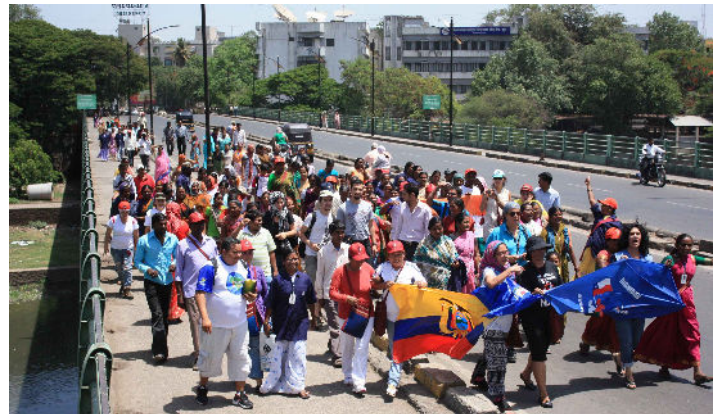
La Alianza Global de los Recicladores marcha en el Día del Trabajo - Pune, India

Después del taller, el 1 de mayo, muchos de los representantes internacionales se quedaron en India para participar en la manifestación del Día del Trabajo durante la cual la corporación del municipio de Pune le entregó un premio a SWaCH y anunció que extendería el sistema integrado de “residuos cero”, el cual había puesto a prueba el año pasado junto con SWaCH, en 15 distritos más.