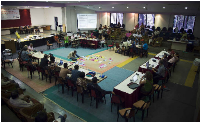
En la sala de conferencias.

De manera conjunta a la conferencia, se realizaron entrevistas con representantes selectos para juntar información y crear estudios de caso de modelos de gestión de residuos. Estos perfiles de varias ciudades incluirán un resumen sobre los recicladores, sus organizaciones, y la relación entre los sistemas de gestión de residuos formales e informales en sus municipios. Un informe que contiene estos perfiles será publicado pronto.