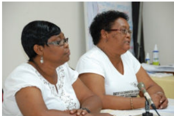
Lancement du Réseau des travailleuses domestique des Caraïbes