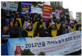
"12 pour 12" Campagne en Corée du Sud