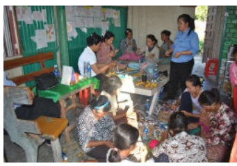
Membres de l'Association dans une formation de développement de produits