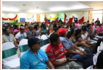
Conférence des Récupérateurs