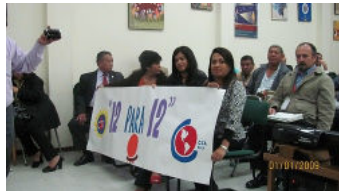
"12 pour 12" Campagne en Colombie