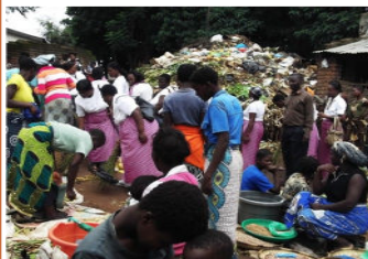
Les femmes MUFIS nettoient la marché Manase