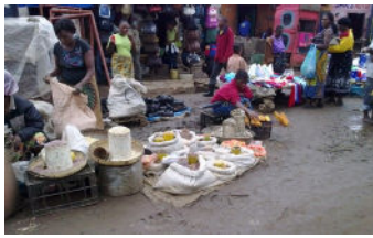
Vendeurs de Rue, Zambia