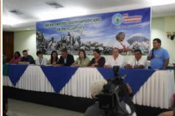
Table d'honneur de panélistes comprenait des dirigeants de récupérateurs, Ministre de l'environnement, et les partisans