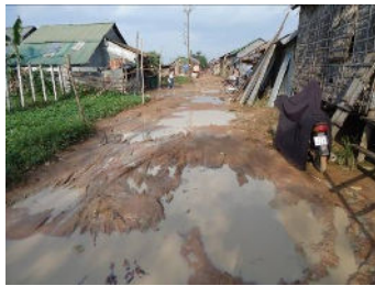
Teak Sin Khang bidonville du vil- lage dans la saison des pluies