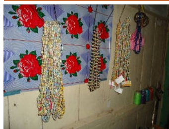
Bijoux (ci-dessus) et sacs à main (ci- dessous) produites par association des artisanes d'Angkor fabricantes de pièces en soie khmère