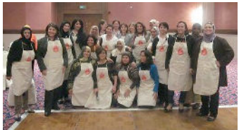
Réunion avec le Réseau des femmes arabes soutenant la Campagne "12 pour 12"