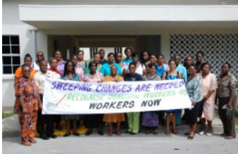
Lancement du Réseau des travailleuses domestique des Caraïbes Photo par ONU spécialiste des communications; voir page 3 pour plus d'informations