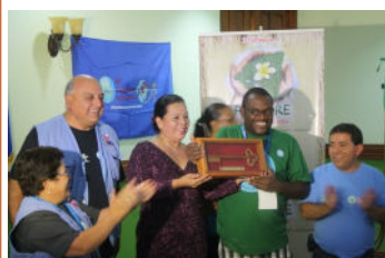
RedLacre reçoit les "Clés de Mana- gua" du Maire