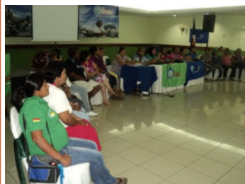
Les Récupératrices prennent le contrôle de l'assemblée pour discuter de questions de genre