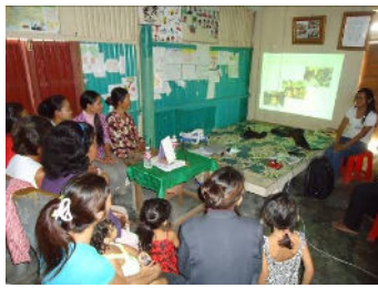
Membres de l'Association et leurs enfants dans une formation en leadership