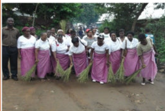
Femmes de MUFIS célèbrent la Journée Internationale de la Femme marché Manase en balayant pour protester contre l'abandon de la ville