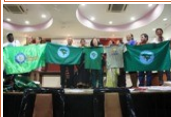
Fotos do segundo dia do Workshop Estratégia Global em Pune, Índia (para cima e para baixo)