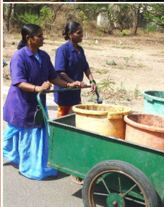
Foto tirada durante a visita do sistema de gestão de resíduos sólidos, uma parte do Workshop Estratégia Global em Pune, Índia