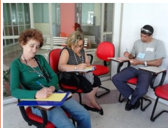
Vendedores ambulantes del centro de Rio (arriba) y Porto Alegre (abajo) escriben cartas de demandas