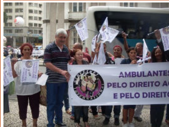
Vendedores ambulantes de Rio en el Río +20 movilización con Presidente de StreetNet Oscar Silva

“Nuestra subsistencia está en riesgo porque enfrentamos amenazas sistémicas por parte de las autoridades públicas, abandono, prejuicios y obstáculos persistentes. Sólo nos queda concluir que las autoridades públicas pretenden acabar con el comercio informal en la ciudad y privatizar muchos espacios públicos vigentes.”