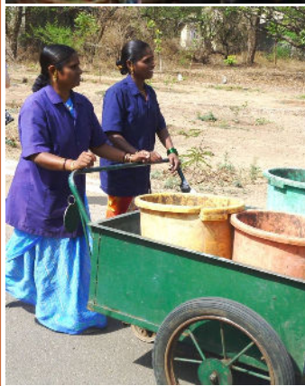
Foto tomada durante la visita del sistema de manejo de desechos sólidos (MDS), una parte del Taller para la Estrategia Global en Pune, India