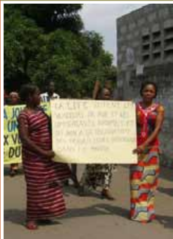
Foto por LDFC, utilizada en La Única Escuela que Tenemos (pág. 51)