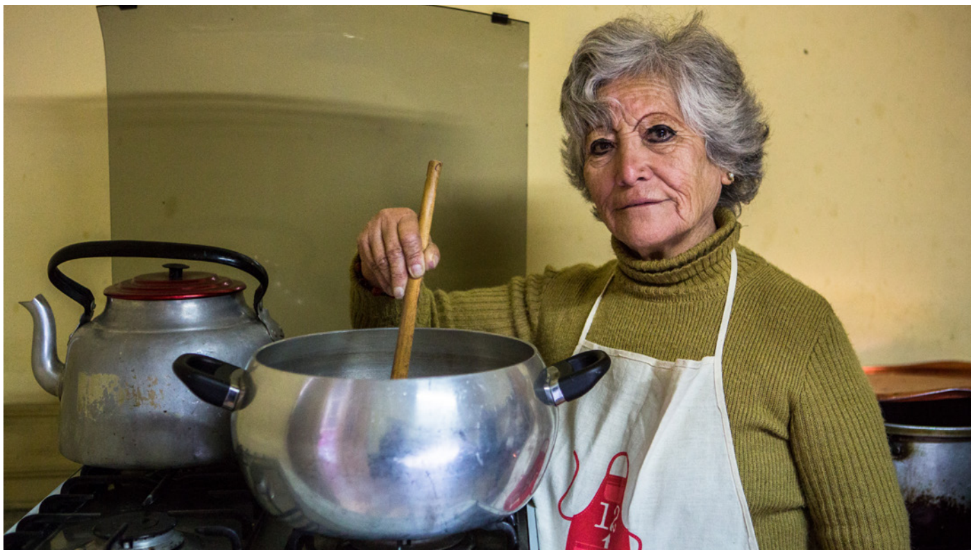
Los lugares de trabajo, como los hogares privados, hacen a las mujeres susceptibles a la violencia debido al aislamiento y la falta de acceso a mecanismos de denuncia y recursos legales.

realizan actividades económicas (OIT 2016: § 5). Estas se basan en la Recomendación de la OIT sobre la transición de la economía informal a la economía formal de 2015 (No. 204), que reconoce la necesidad de un acceso regulado al espacio público y al uso de los recursos naturales públicos. Los domicilios privados donde operan los trabajadores a domicilio y del hogar son considerados como lugares de trabajo de alto riesgo debido al aislamiento de estos (OIT 2016: § 14).