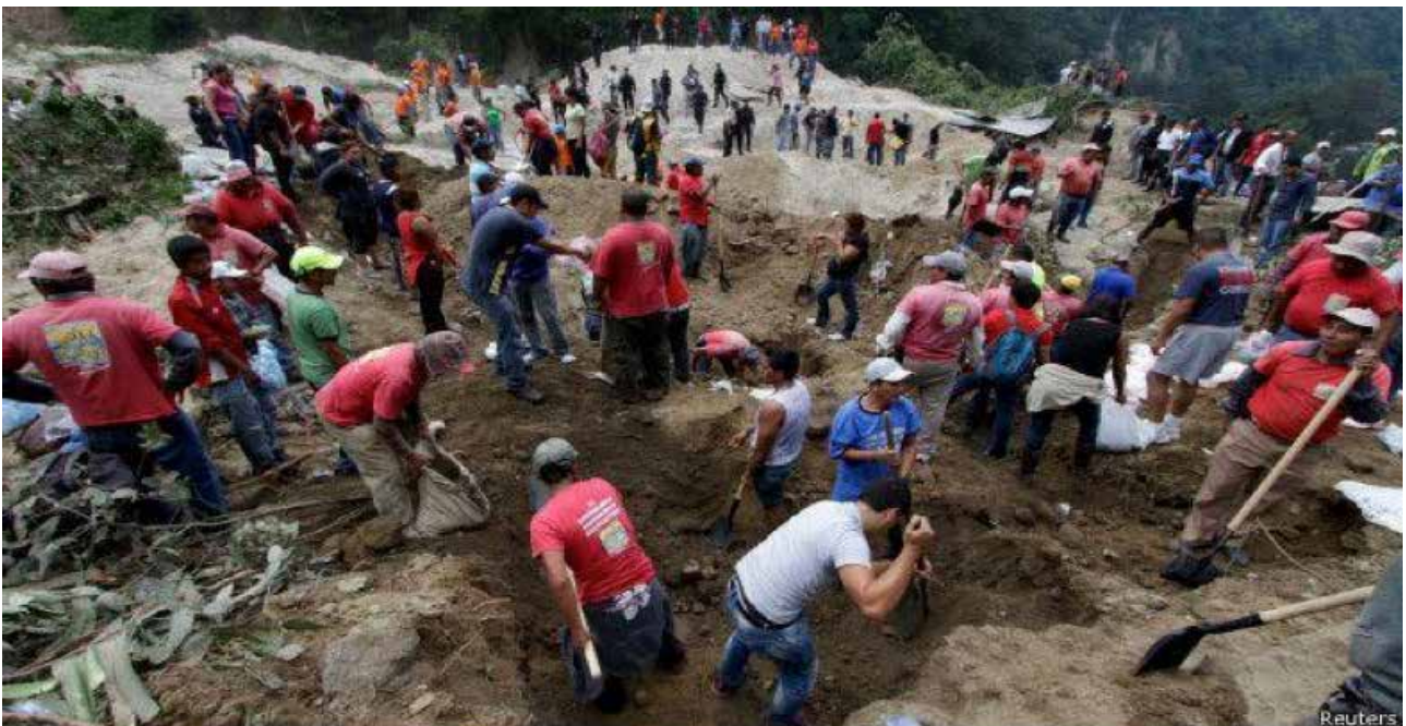
Fuente: Reuters. En: http://www.bbc.com/mundo/noticias/2015/10/151002_guatemala_deslave_desaparecidos_a0

Por Juan Paullier para BBC Mundo, Centroamérica, 3 octubre 2015. En: http://www.bbc.com/mundo/noticias/2015/10/151002_guatemala_deslave_desaparecidos_a0