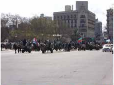
Marcha de los Carros 2012