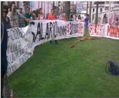
Reclamo ante el MTSS- 4/2017