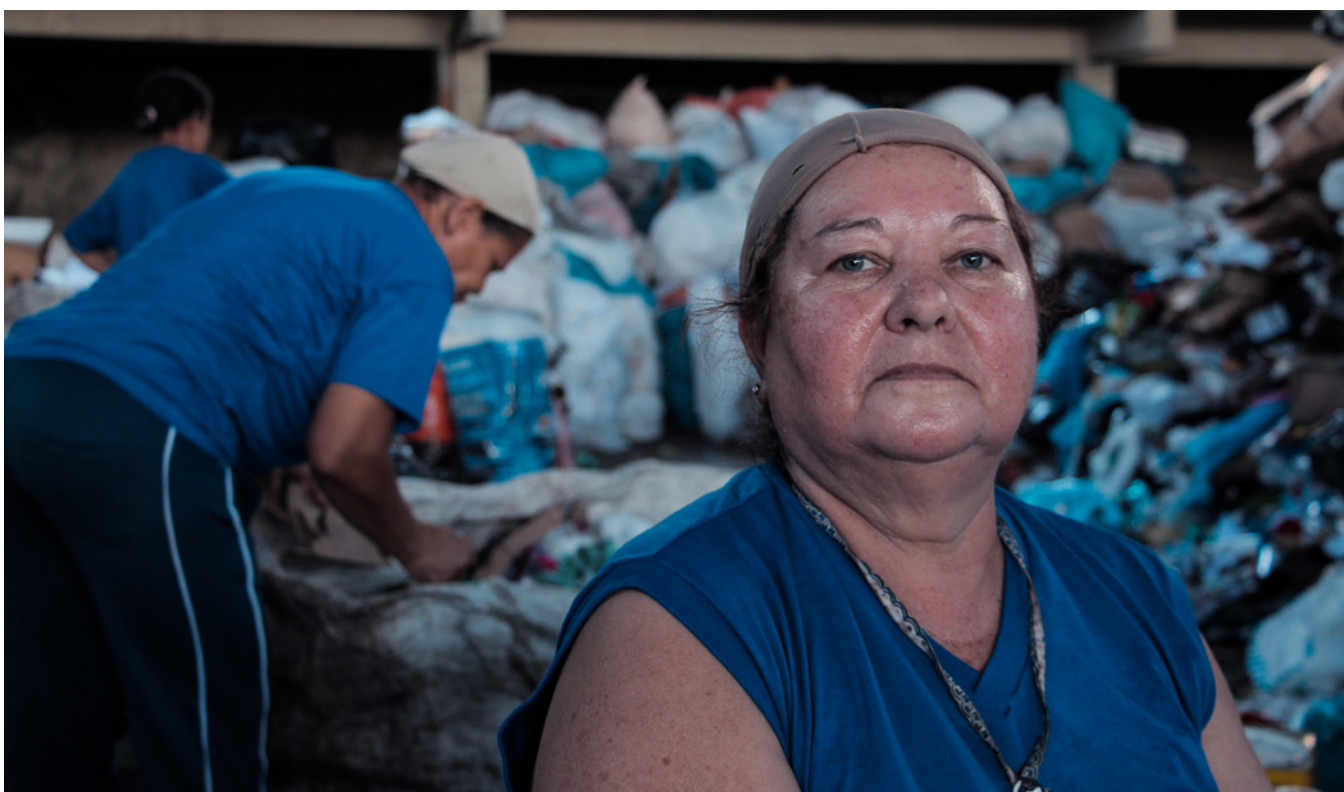
Catadores de materiais recicláveis que participaram de um projeto voltado para a saúde denominado Projeto Cuidar em Belo Horizonte, Brasil.