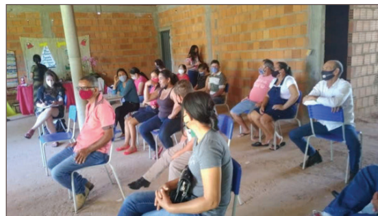
Reunión en la escuela municipal José Belém de Souza en Peri Peri, en el distrito de Miravânia (Minas).

En todas las reuniones, se presentó el proyecto “Ancestralidad: recuperar conocimiento para construir el futuro”, respaldado por HomeNet Internacional y WIEGO. Las personas participantes debatieron en torno al Convenio sobre el trabajo en domicilio (C177) de la Organización Internacional del Trabajo, los instrumentos de regularización, los principios de la economía solidaria y los fondos de rotación solidarios. También se aplicó un cuestionario a las personas afiliadas a ATEMDO, con 79 preguntas sobre las condiciones de vida y de trabajo.