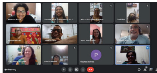
La reunión de ATEMDO con la asociación ArtSol de Aracati (Ceará) fue virtual.