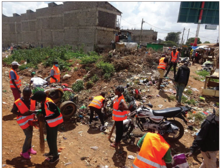
Personas recicladoras de Walakolo en su primera limpieza de 2022.

El grupo autogestivo de personas recicladoras 42 Kibera Walakolo se formó en julio de 2021, como resultado de consultas entre sus miembros y de deliberaciones que surgieron de la participación de una persona del grupo en una reunión que WIEGO había organizado en Kisumu el año previo.