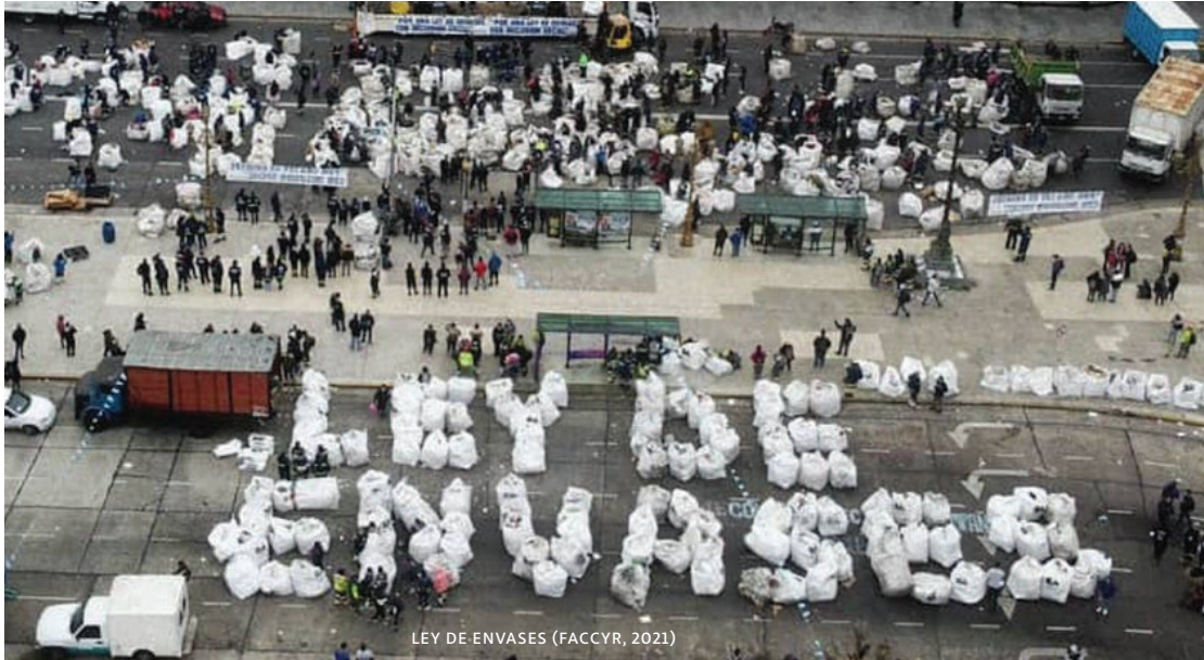
LEY DE ENVASES (FACCYR, 2021)