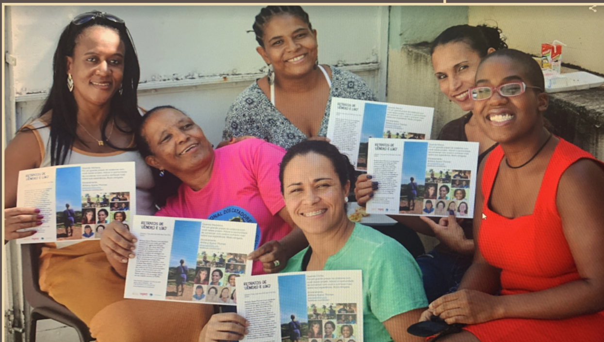
Exposição Retrato de Gênero e Lixo na Galeria Espai: As mulheres são pioneiras nas lutas pela preservação ambiental e na reciclagem. Belo Horizonte, 2016.