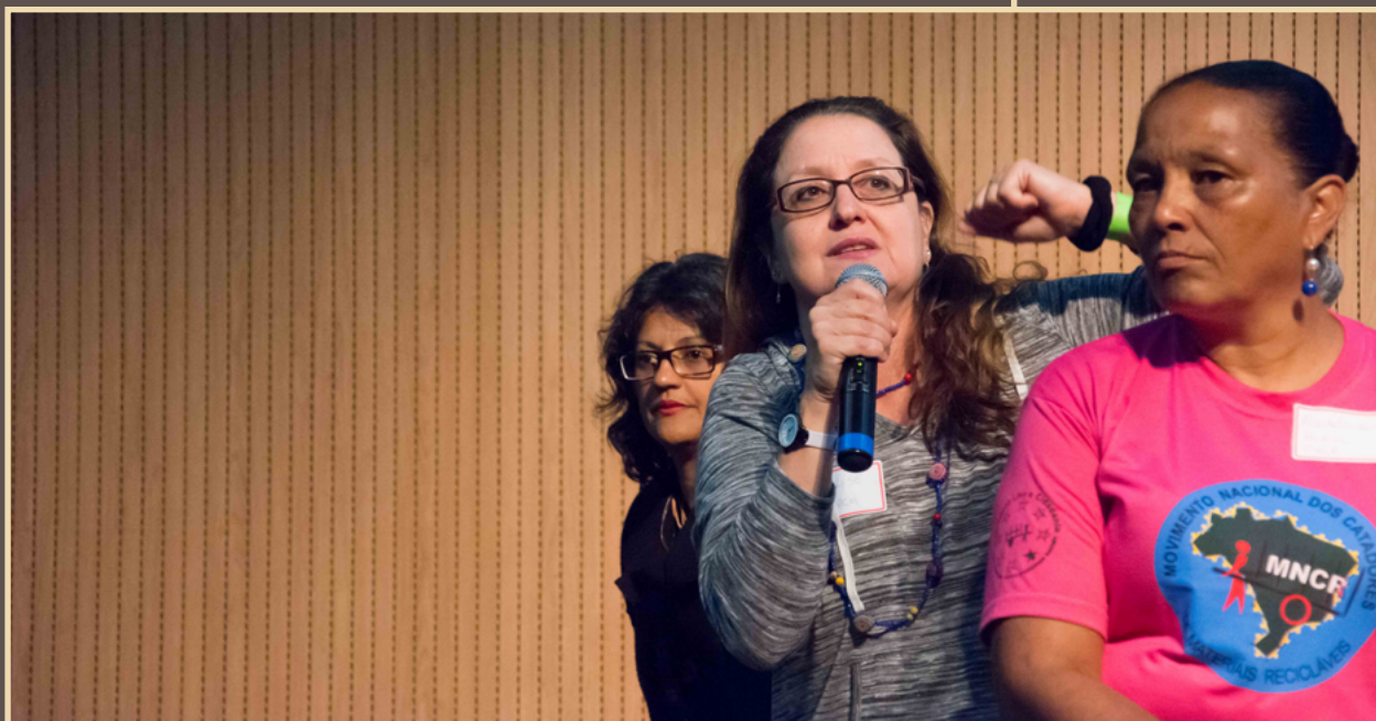
Encontro internacional de devolutiva projeto de gênero: refletindo sobre as diversas formas de desigualdade de gênero na sociedade e seus impactos para trabalhadores-as informais. Belo Horizonte, 2015.