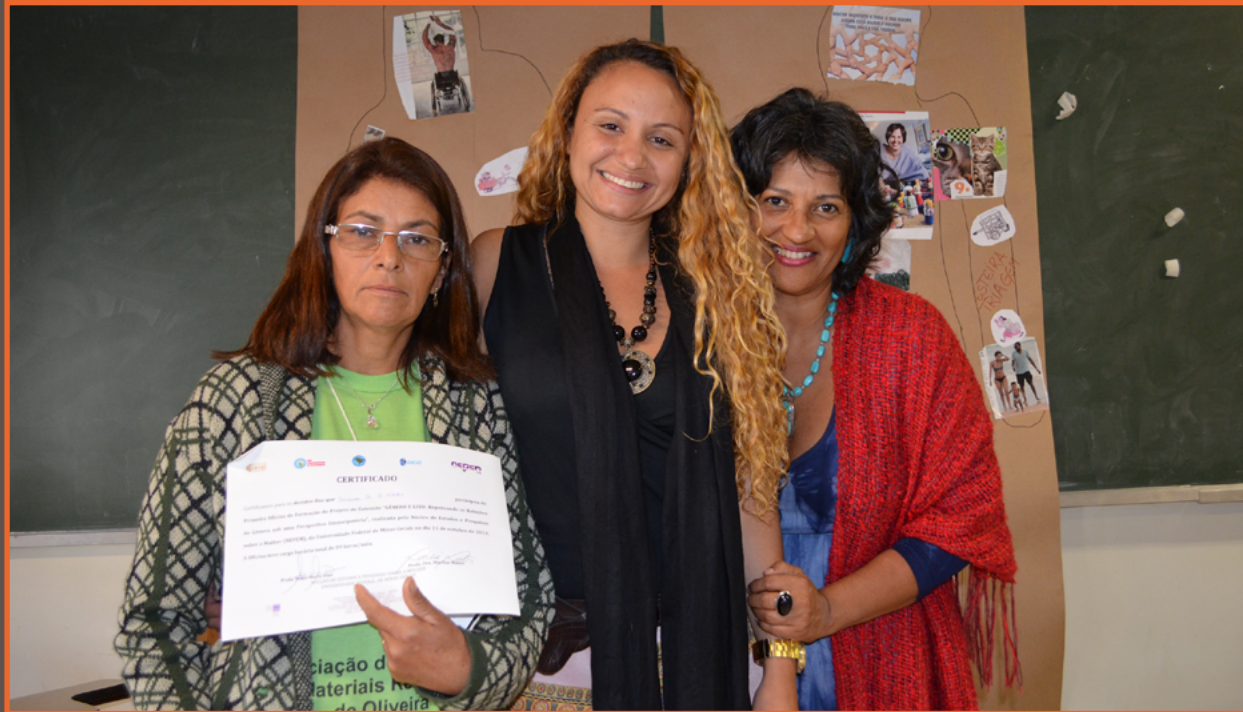
Certificando as catadoras em gênero através da oficina de pesquisa-ação do Projeto de Gênero. Belo Horizonte, 2012.

Waste pickers receive certificates after participating in the Gender and Waste action-research workshop. Belo Horizonte, 2012.