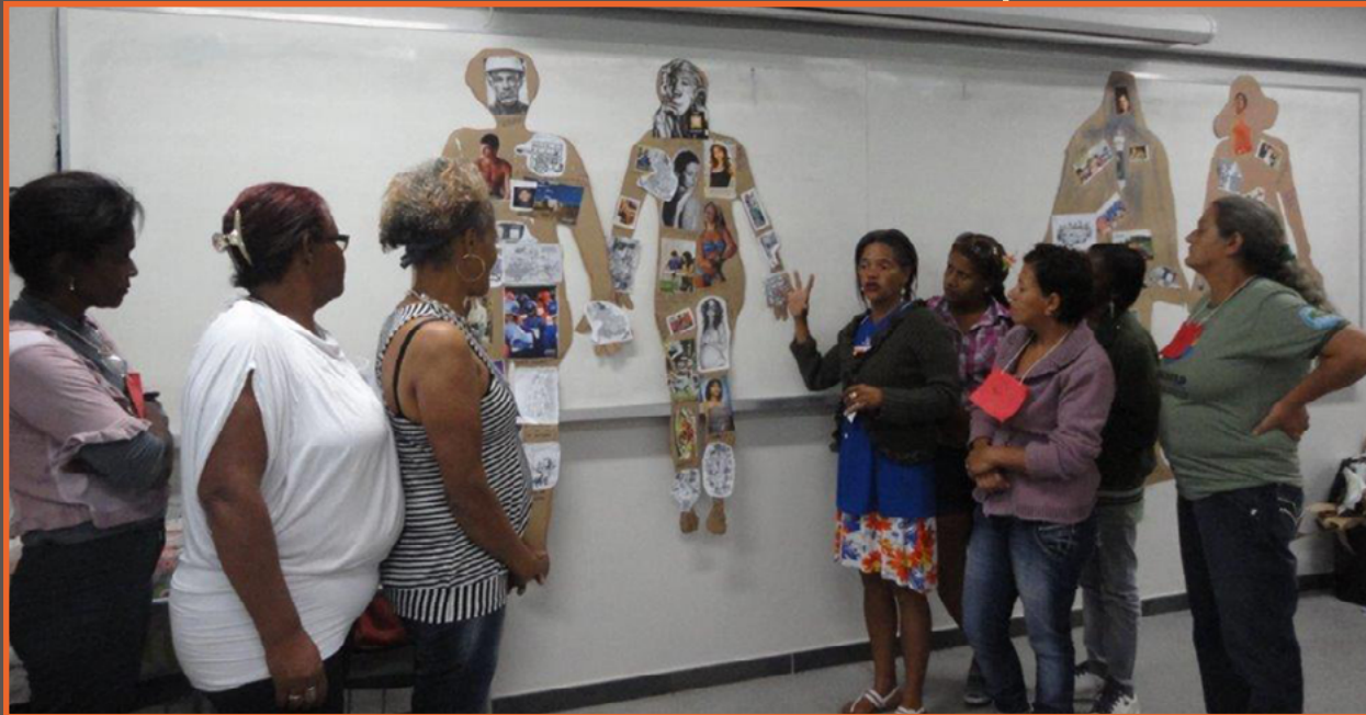
Oficina de Pesquisa-ação: Catadoras discutem que diferença da mulher o homem tem? Belo Horizonte, 2012.

Action research workshop: Women waste pickers discuss gender differences. Belo Horizonte, 2012.