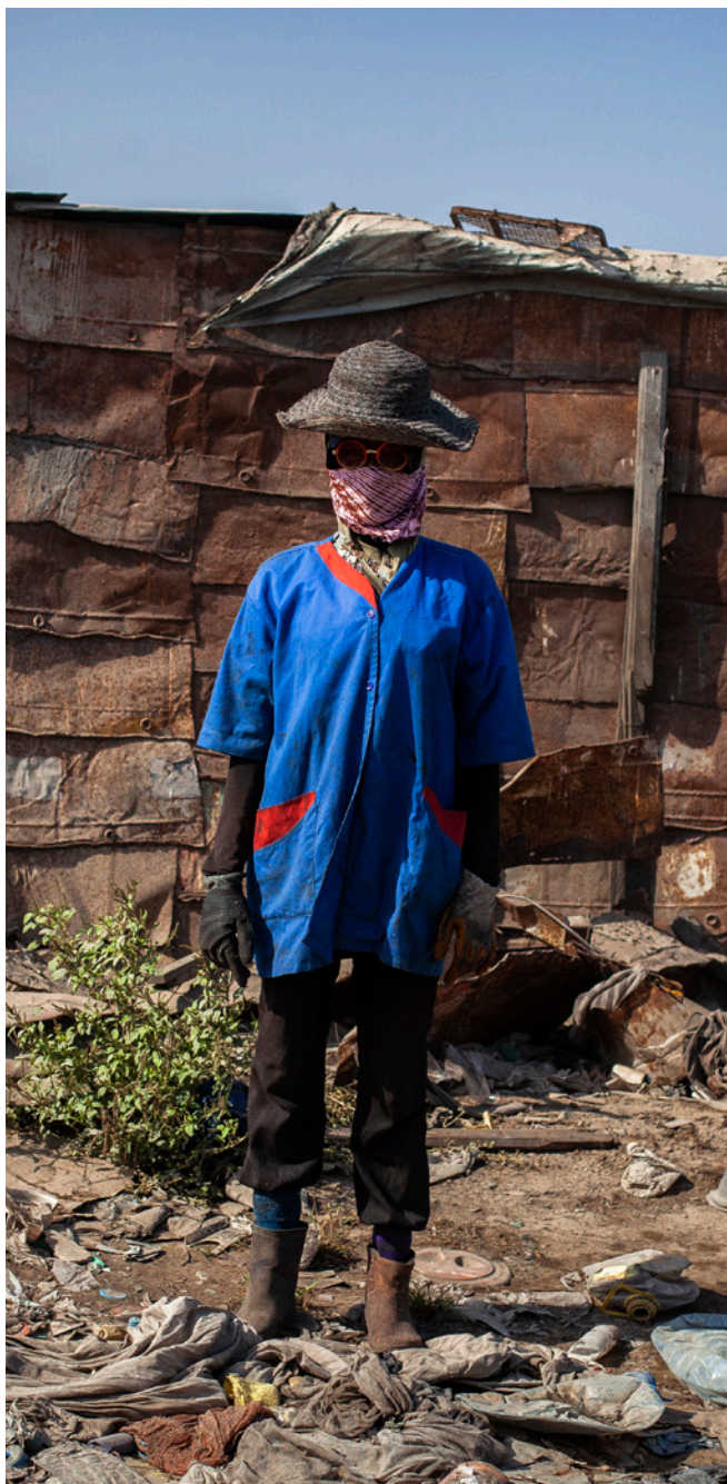
Une récupératrice de déchets travaillant à la décharge de Mbeubeuss.