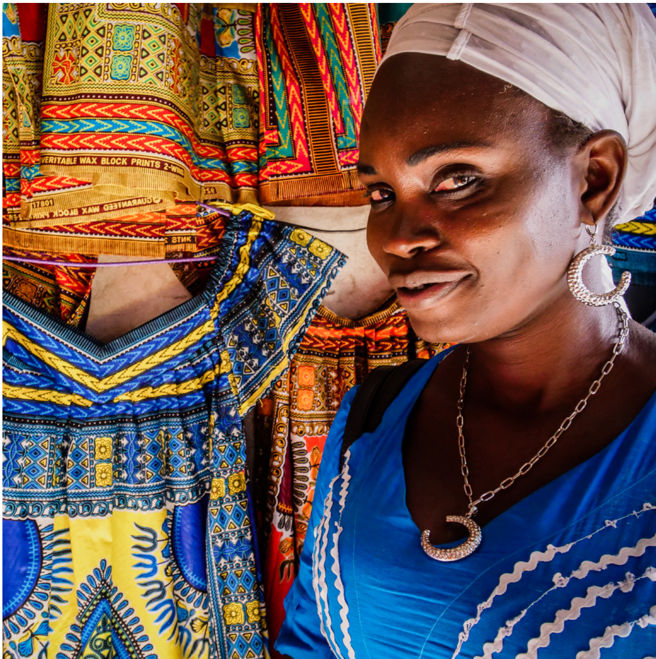
Une vendeuse de rue à Dakar.

Dans les trois zones géographiques, ce sont les commerçantes de marché qui ont bénéficié le plus d'un enseignement secondaire : 27 % à Dakar, 21 % en milieu urbain du Sénégal et 17 % à l'échelle nationale. Pour le reste des groupes, moins de 15 % des femmes ont fait des études secondaires au niveau national et, à ce même niveau, le pourcentage des femmes (ainsi que des hommes) non-scolarisées augmente, par rapport à Dakar, mais des disparités importantes entre les sexes persistent. Chez les hommes, environ un tiers des travailleurs domestiques et des travailleurs à domicile de Dakar –et environ 20 % dans l'ensemble du pays– ont terminé leurs études secondaires avec succès. Dans tous les groupes, les parts des femmes et des hommes ayant achevé des études supérieures sont généralement inférieures à 5 %.