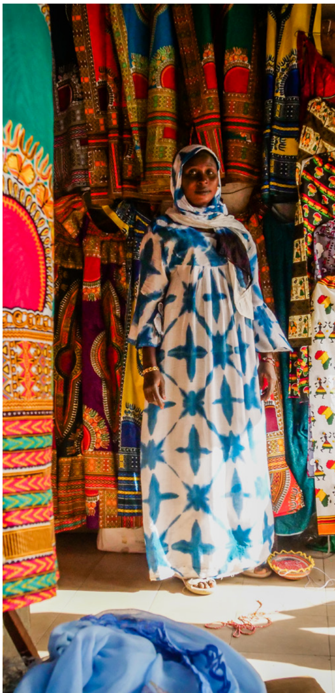
| Une vendeuse de rue à Dakar, au Sénégal.