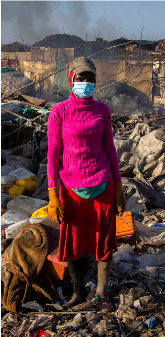
Une récupératrice de déchets travaillant à la décharge de Mbeubeuss.