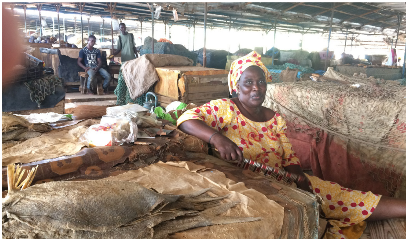
Une commerçante au Marché de Diola Dakar.

Dakar, par exemple, une grande partie des commerçant·e·s sont des employé·e·s (43 % des femmes et 42 % des hommes) et des indépendant·e·s (43 % des femmes et 34 % des hommes). En outre, 3 % des femmes et 6 % des hommes sont des employeur·euse·s, 1 à 2 % des femmes et des hommes sont des travailleur·euse·s familiaux collaborant et un pourcentage relativement important est constitué d'apprenti·e·s (10 % pour les femmes et 15 % pour les hommes). Parmi les commerçant·e·s, les apprenti·e·s sont également abondant·e·s dans les autres zones géographiques (10 % pour les femmes dans les deux zones et environ 20 % pour les hommes).