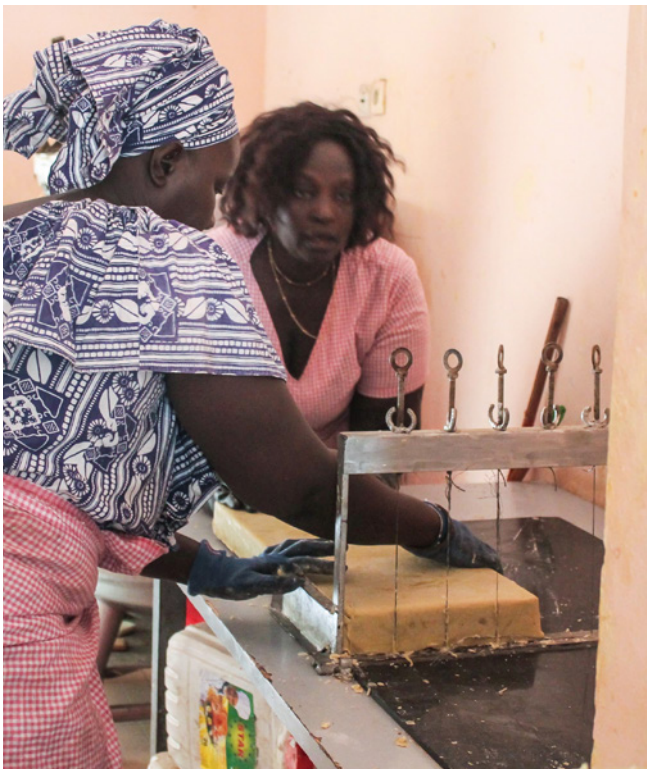
Des travailleuses à domicile à Dakar.

de marché. Cependant, les hommes sont plus susceptibles de travailler dans le commerce de marché que les femmes (27 % pour celles-ci, contre 45 % pour les hommes). À Dakar, le deuxième groupe le plus nombreux est constitué par les vendeur-euse-s de rue, parmi qui les femmes sont davantage concentrées (environ 21 % des femmes employées, mais seulement 9 % parmi les hommes employés). Les femmes sont plus susceptibles de travailler à domicile : 19 % des femmes employées, contre 5 % parmi les hommes occupés ; de même pour le travail domestique : 19 % des femmes occupées, contre 3 % des hommes employés. Dans les deux autres zones géographiques, le commerce de marché est également le groupe prédominant dans l'emploi total, pour les femmes comme pour les hommes, avec des pourcentages plus élevés pour eux que