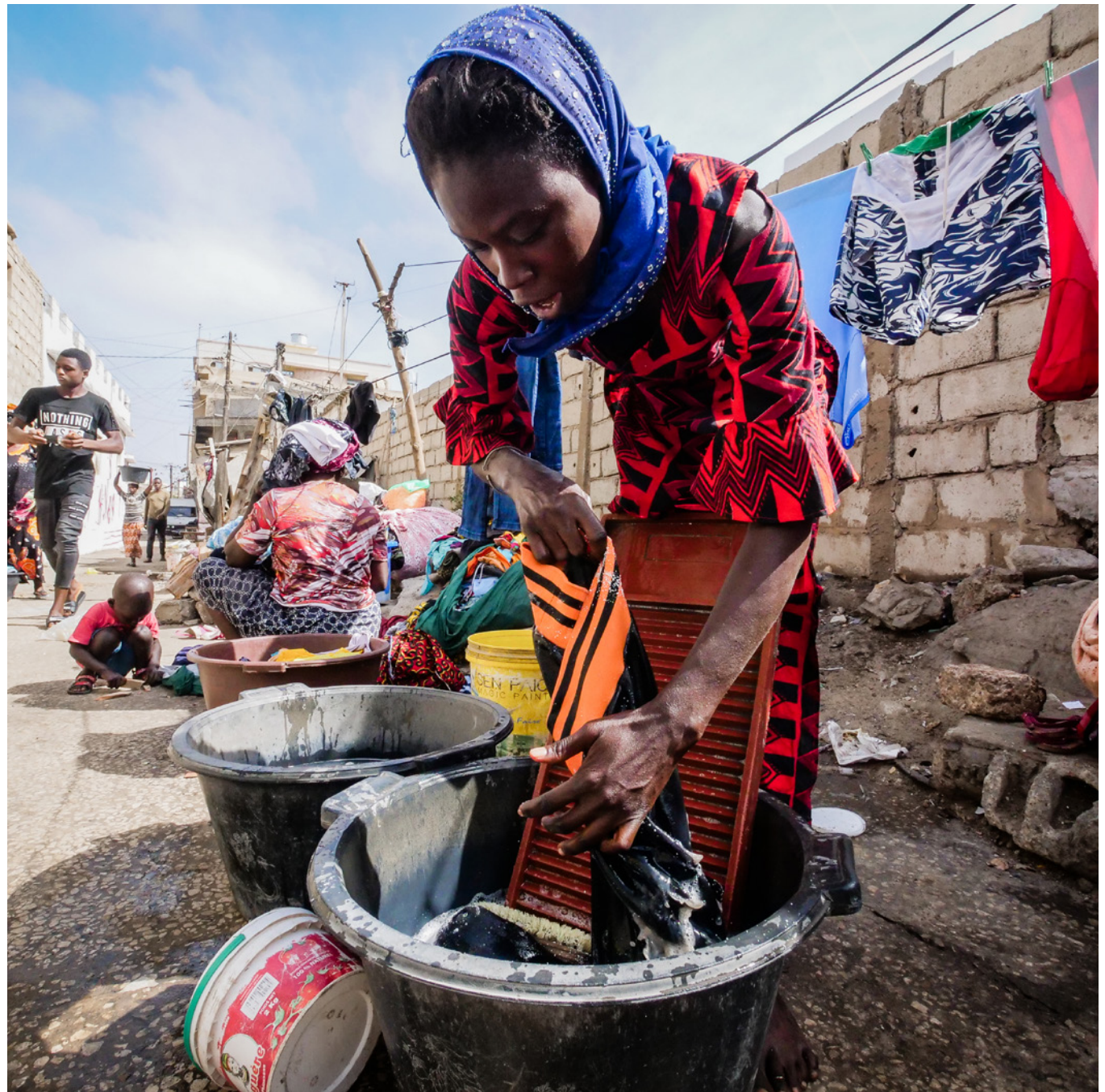
Une lingère à Dakar.

(1) L'emploi est classé comme informel si les travailleur-euse-s ne bénéficient pas d'avantages professionnels, à savoir : prestations médicales, congés maladie ou annuels payés, ou cotisations à la sécurité sociale. L'activité indépendante est classée comme informelle si elle n'est pas déclarée ou si les travailleur-euse-s ne tiennent aucune comptabilité officielle. Le travail familial collaborant (entraide familiale) est également inclus dans l'emploi informel.