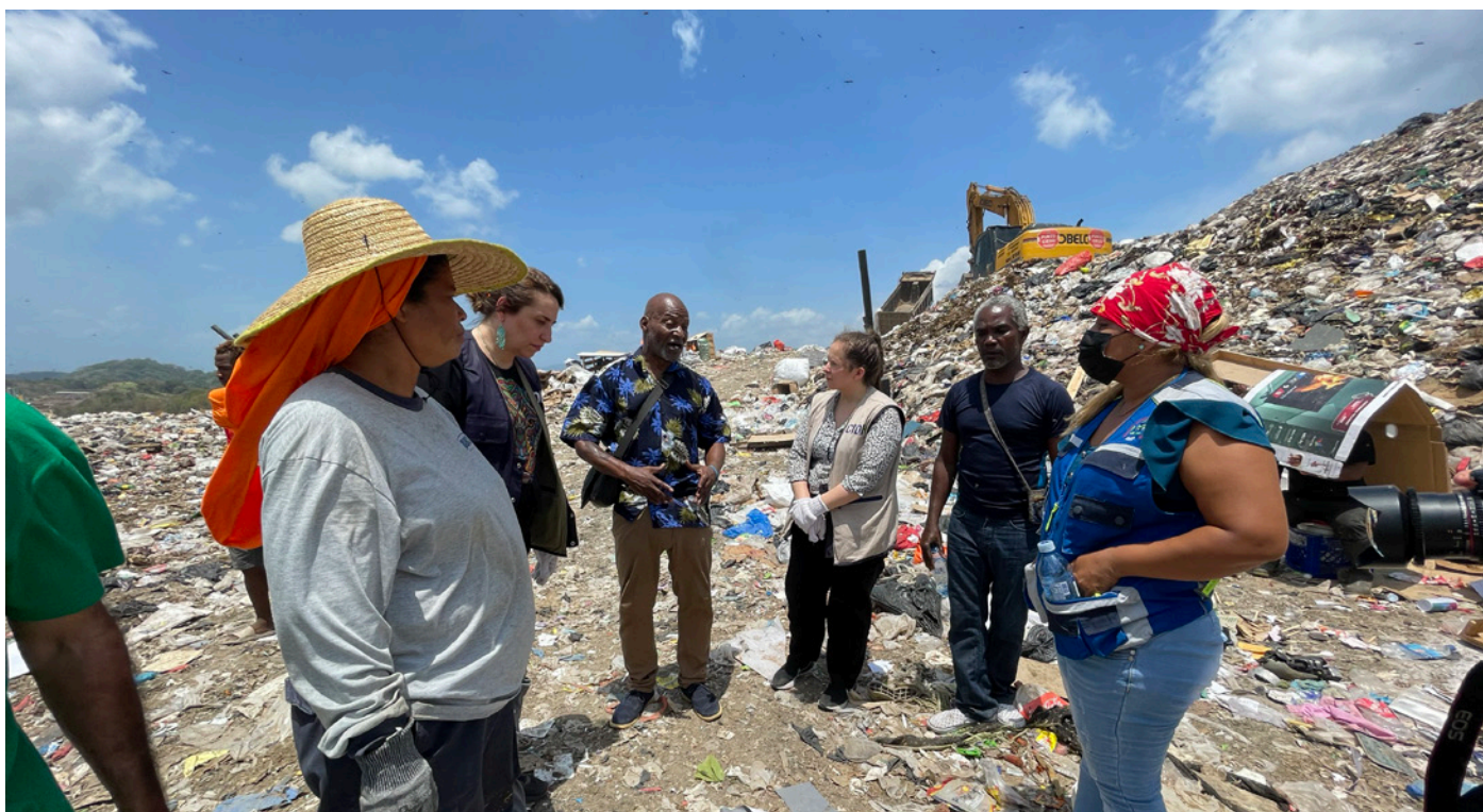
Visita de la Relatora Soledad García al tiradero de Cerro Patacón en Panamá, junto con representantes del Movimiento Nacional de Recicladores de Panamá y de Wiego.

El Programa de Derecho de WIEGO se esfuerza por ver un mundo en el que: