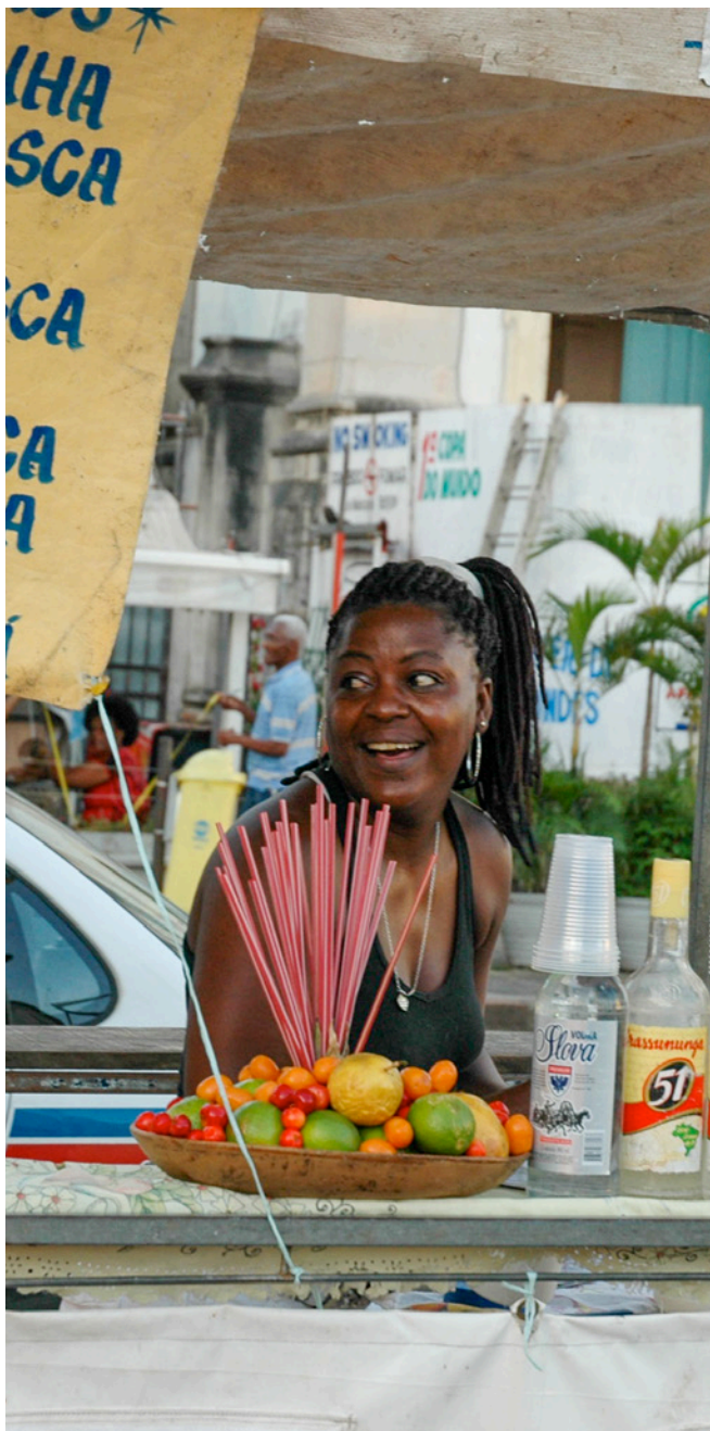
Uma pessoa vendedora ambulante em Salvador, Brasil.