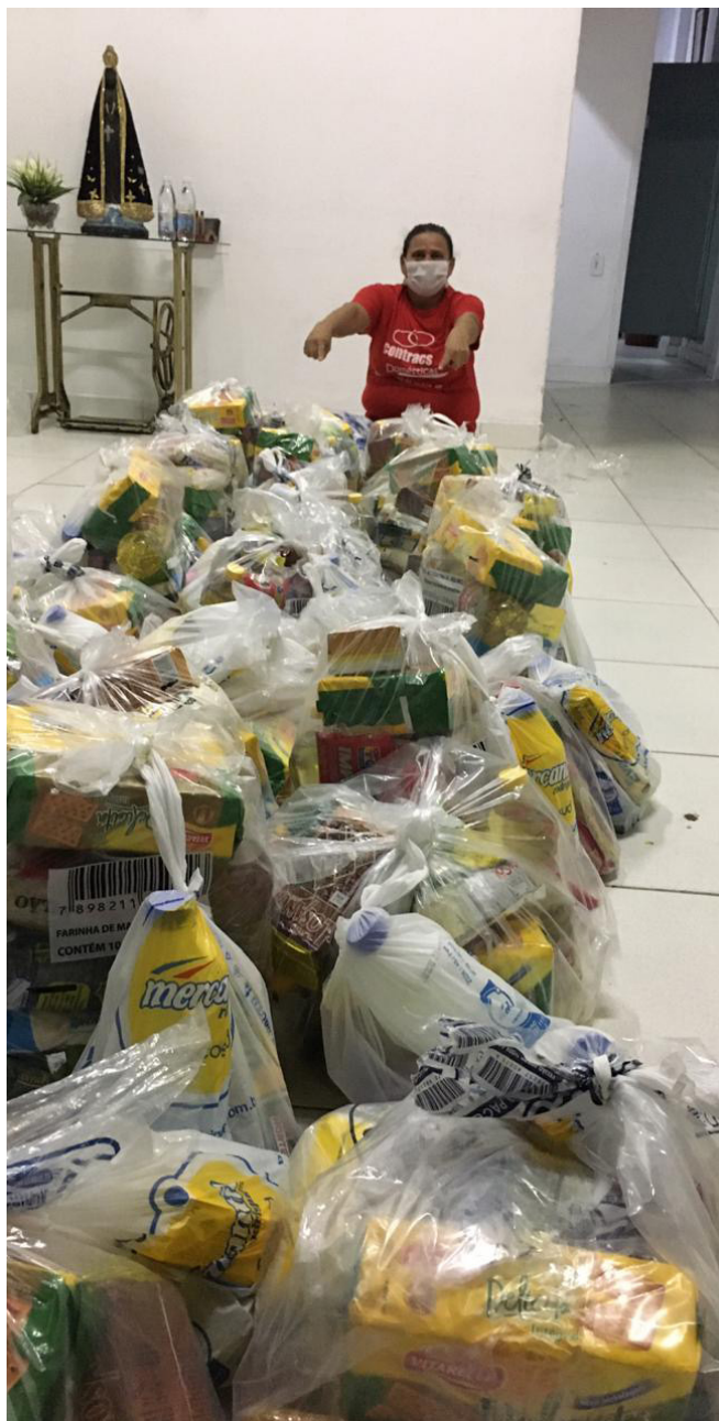
A distribuição de cesta básica pelo Sindicato do Recife ajudou no apoio das pessoas trabalhadoras domésticas que perderam o trabalho durante a pandemia da COVID-19.