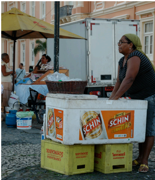
Uma pessoa vendedora ambulante em Salvador, Brasil.

A pandemia da COVID-19 afetou o emprego formal e informal no Brasil; mas o efeito foi maior no emprego informal ( tabela 4 ). Nacionalmente, entre 2019 e 2020, o emprego caiu 8,3 milhões de postos de trabalho, com uma perda de 2,5 milhões em empregos formais e 5,8 em empregos informais. Em termos de variação percentual em relação ao nível anterior de emprego (mudança relativa), o declínio foi de 5% no emprego formal e de 15% no emprego informal. O declínio entre 2019 e 2020 foi maior para as mulheres do que para os homens no emprego formal e informal em todas as regiões geográficas, com uma diferença muito maior para o emprego informal. Nacionalmente, houve queda de 18% para as mulheres e de 12% para os homens no emprego