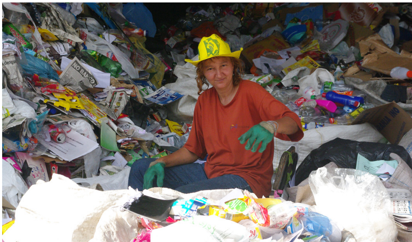
Uma pessoa catadora em Belo Horizonte, Brasil.

Dos grupos, as pessoas catadoras têm os níveis mais baixos de escolaridade. Nacionalmente, 10% não têm escolaridade e 70% têm apenas o ensino fundamental. Entre as mulheres catadoras em todas as regiões geográficas, 80% ou mais têm ensino fundamental como o nível mais alto de educação. Entre os homens, a estatística comparável é de cerca de 40% em São Paulo e 65% nas outras duas regiões geográficas.