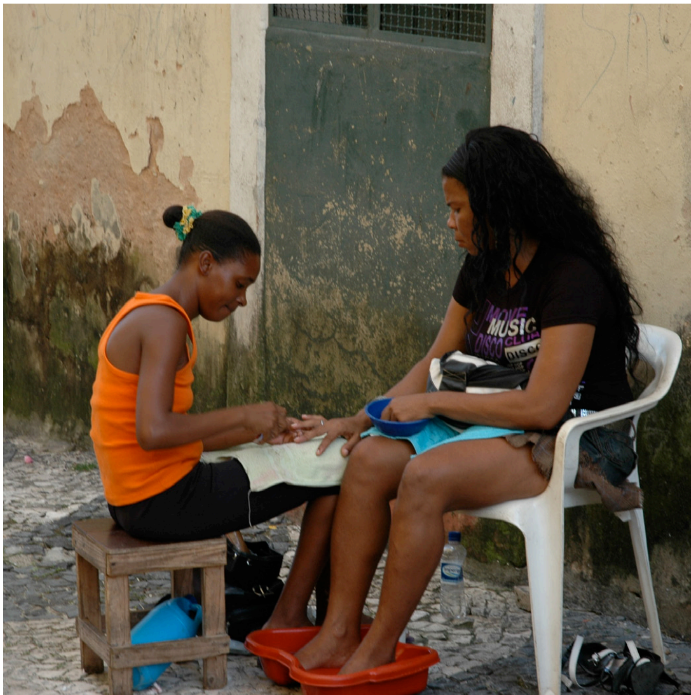
Uma jovem pessoa vendedora ambulante oferece serviços de manicure e pedicure.

Nas idades mais jovens (14 a 24) a proporção de pessoas empregadas nos cinco grupos é menor do que nas idades mais avançadas, e menor do que entre o total de pessoas empregadas: cerca de 11% nos cinco grupos contra 15% no total de pessoas empregadas. As mulheres estão sub-representadas na categoria de idade mais jovem em comparação com a população total, por exemplo, nas