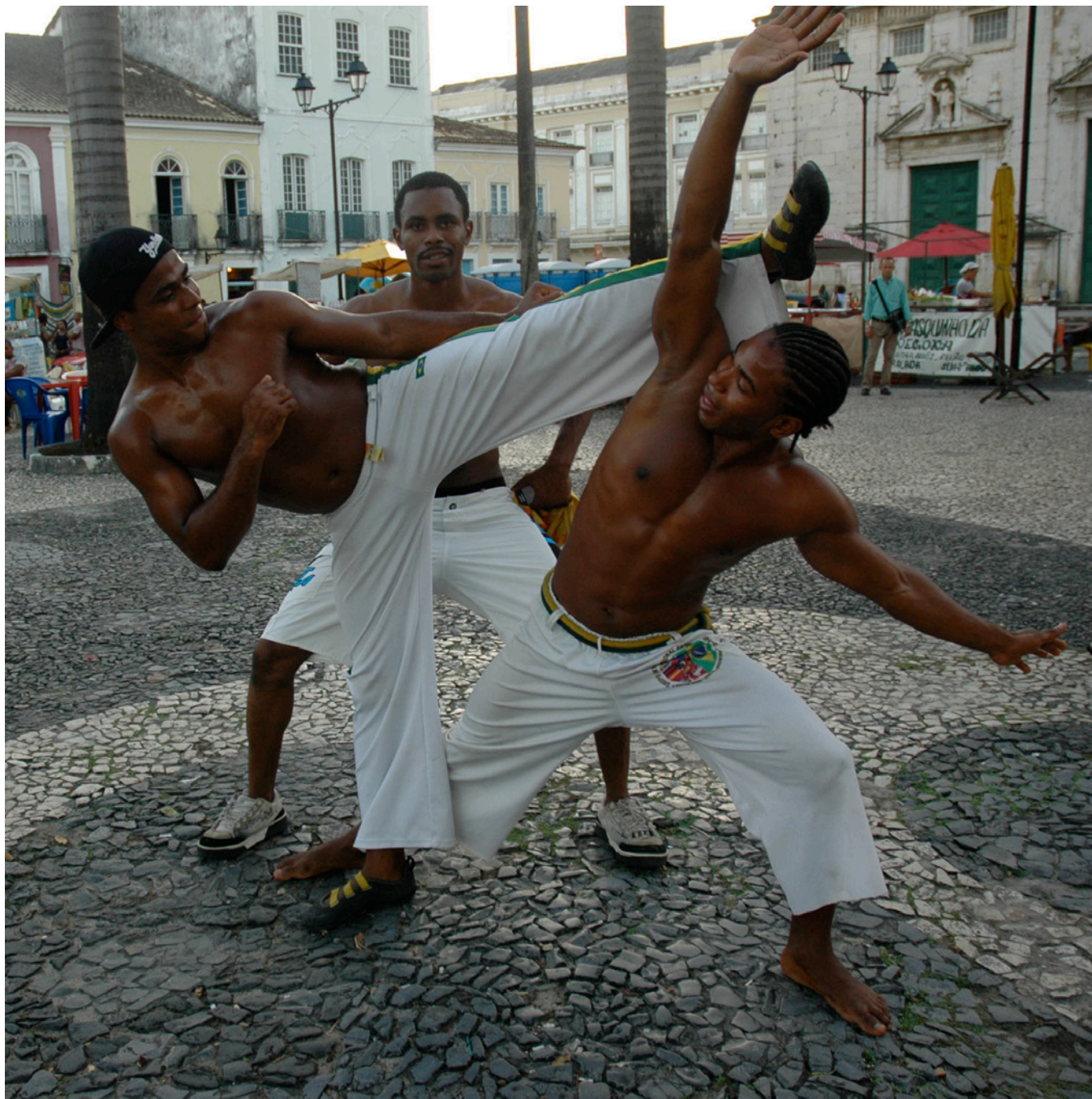
Artistas de rua em Salvador, Brasil.

Depois das pessoas trabalhadoras domiciliares, as pessoas vendedoras ambulantes são o grupo com maior proporção de educação de nível superior. Entre as mulheres, 16 a 22% das vendedoras ambulantes têm ensino superior em todas as regiões geográficas; entre os homens, 12 a 24%. Outras tabelas mostram que a maioria (78%) das pessoas vendedoras ambulantes com educação superior são pessoas vendedoras em domicílio. Embora sejam altamente escolarizadas, mais da metade têm emprego informal.