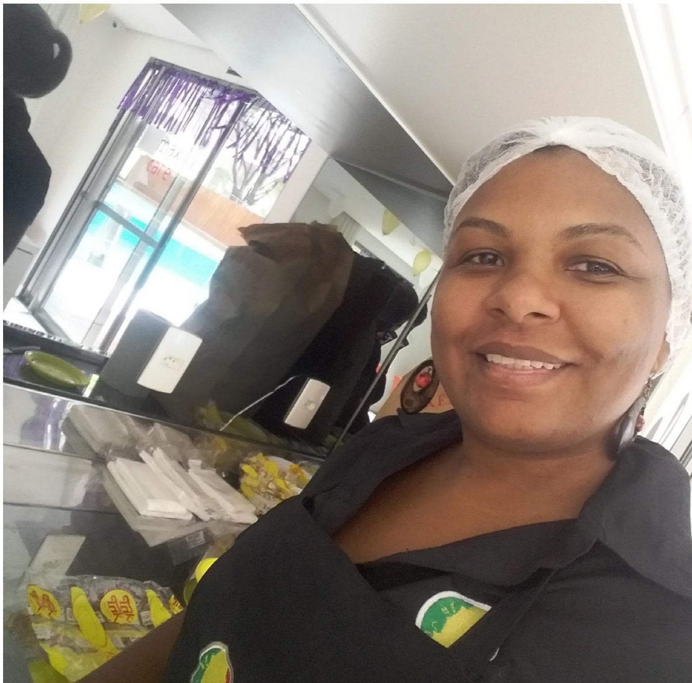
Autorretrato de uma pessoa trabalhadora domiciliar em Osasco, Brasil.

homens. Em São Paulo, essa incidência cai para 59% entre as mulheres, mas é de 69% entre os homens. Entre as pessoas comerciantes de mercados, 68% são pretas ou pardas no âmbito nacional e urbano, e 53% em São Paulo. Este número é maior para as mulheres, chegando a 70% a nível nacional e 66% para os homens. Entre as pessoas vendedoras ambulantes, 61% são pretas ou pardas nacionalmente e no Brasil urbano, em comparação com 49% em São Paulo. Uma proporção maior do que a dos homens de mulheres vendedoras ambulantes é preta ou parda.